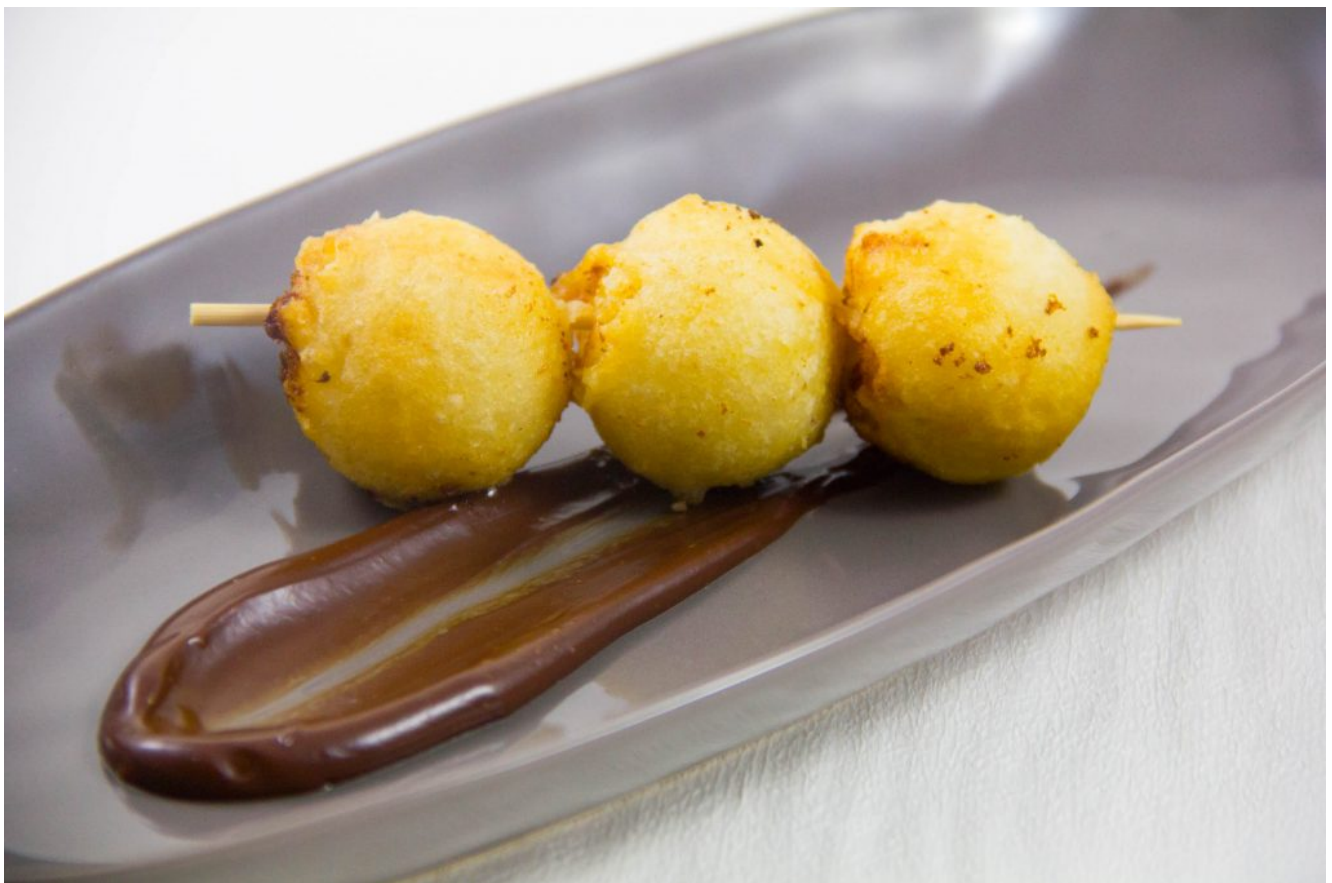
Beignets à la vanille de Philippe Conticini (recette en vidéo)