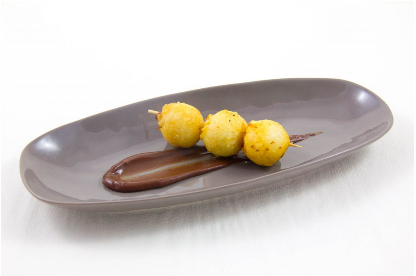
Beignets à la vanille de Philippe Conticini