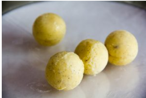
Assemblage des demi-sphères

bien comprendre la technique regardez bien la vidéo du chef en fin d'article et surtout mettez des gants pour cette opération (à la fois pour une question d'hygiène mais aussi pour garder vos mains bien propres). Conservez-les filmées au congélateur le temps de préparer la pâte à beignet.