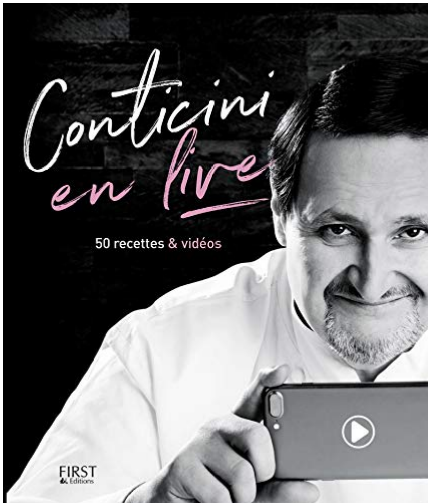
Philippe Conticini en live