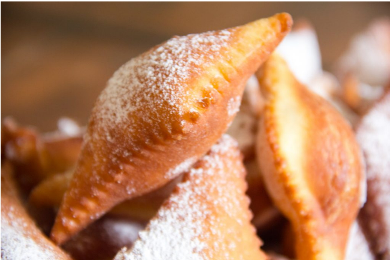
Beignets de carnaval (les ganses de mon arrière grand-mère)