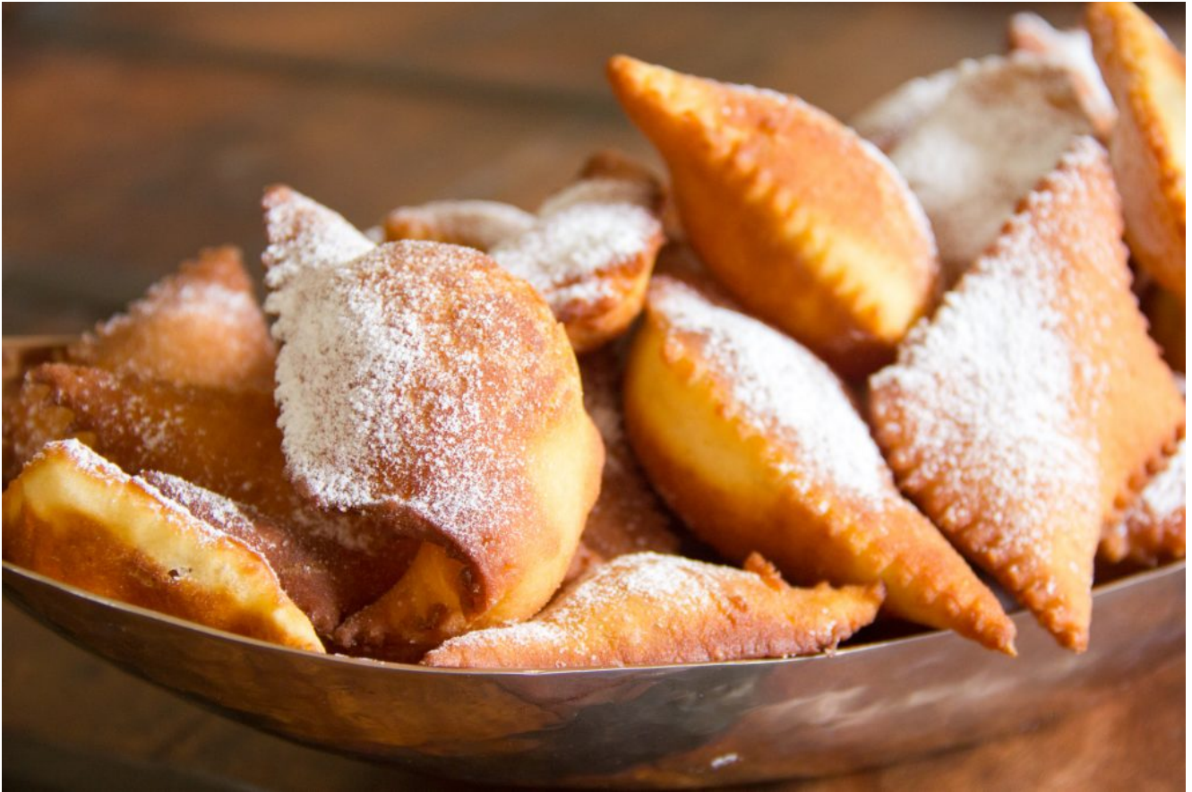
Beignets de carnaval (les ganses de mon arrière grand-mère)