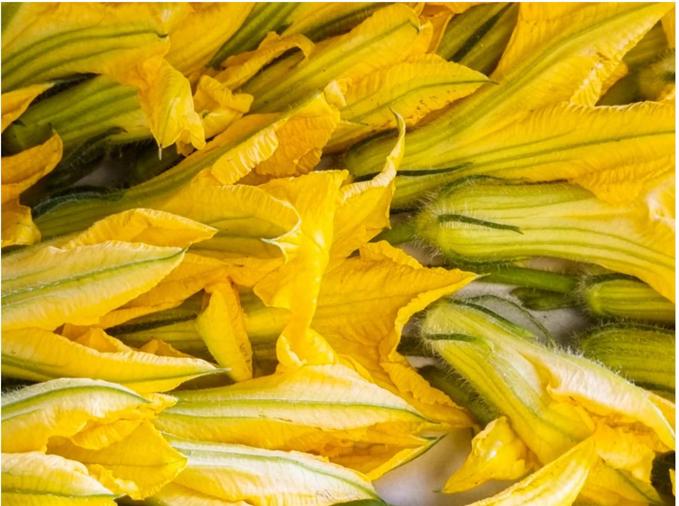
fleur de courgette

C'est bientôt la fin des vacances et des dernières fleurs de courgette. En promenade au merveilleux marché provençal du vieux Valbonne dans les Alpes maritimes j'ai trouvé ces petits diamants qui n'attendaient qu'à être cuisinés. Alors si ce n'est pas déjà fait on en profite vite en réalisant de délicieux beignets que vous servirez en apéritif ou en entrée!