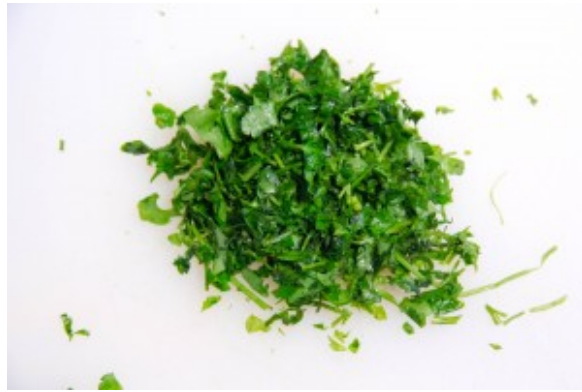
Hachez des feuilles de persil