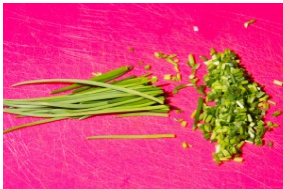
Hachez finement la ciboulette