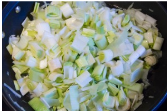
Faire revenir doucement à la poêle