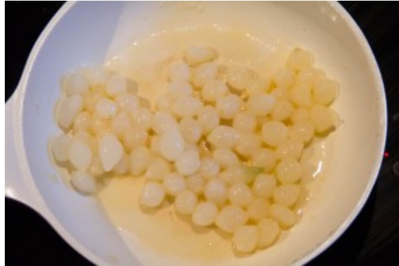
Cuire les oignons avec du beurre