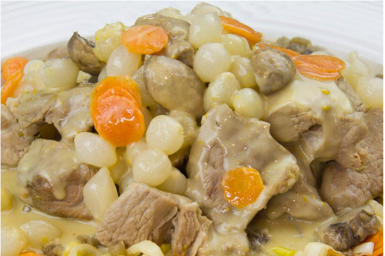
Blanquette à l'orange sous vide basse température