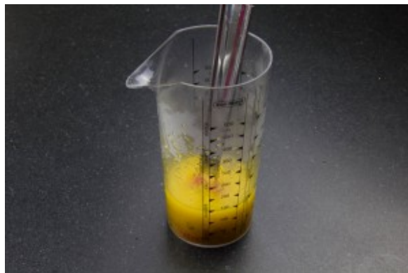
Délayez le bouillon cube de légume dans le jus de l'orange