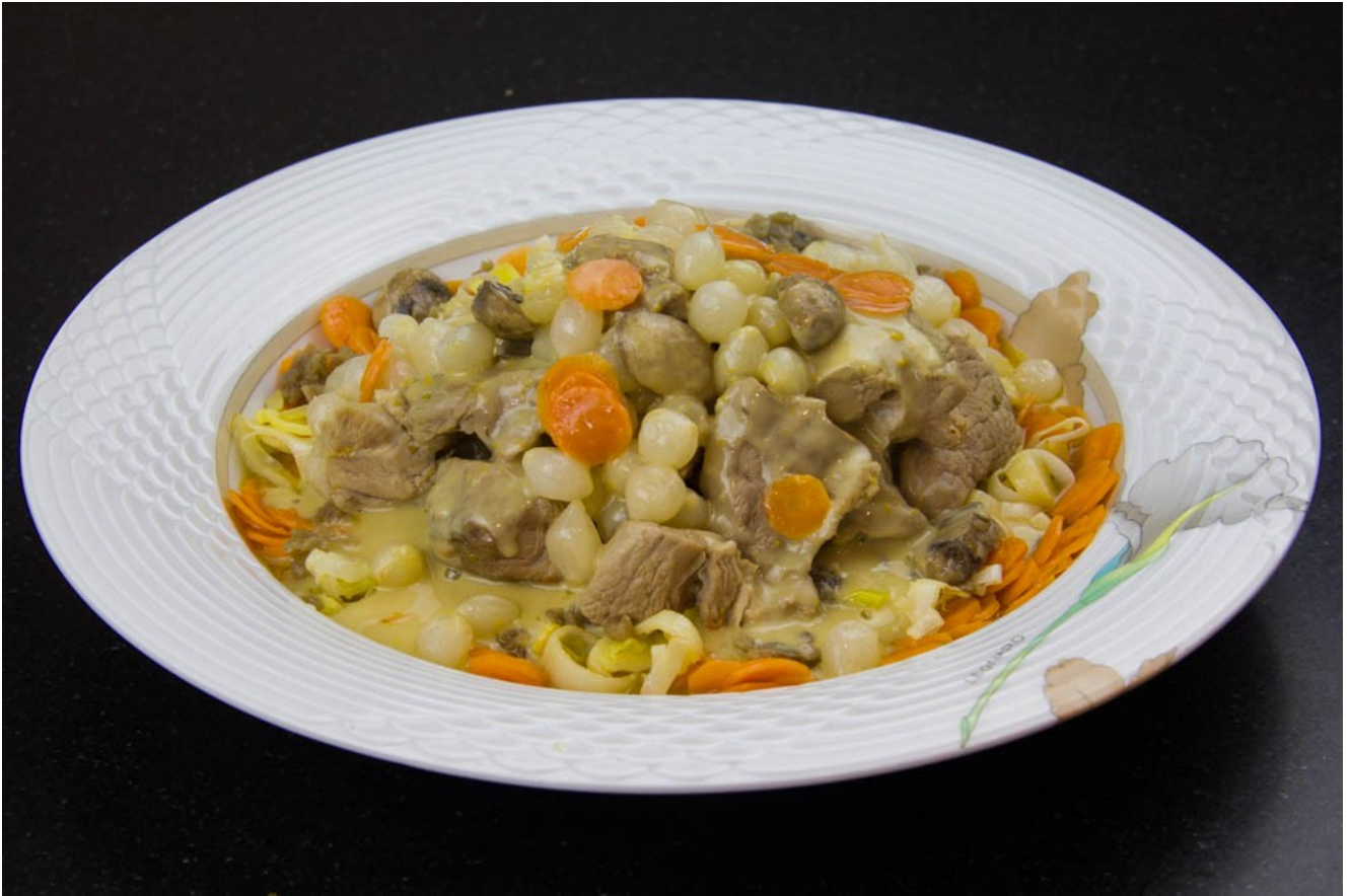
Blanquette à l'orange sous vide basse température