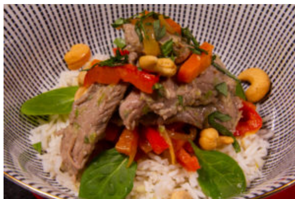
Bœuf asiatique et ses petits légumes