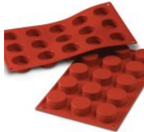
moule - 15 - petits - fours - ronds