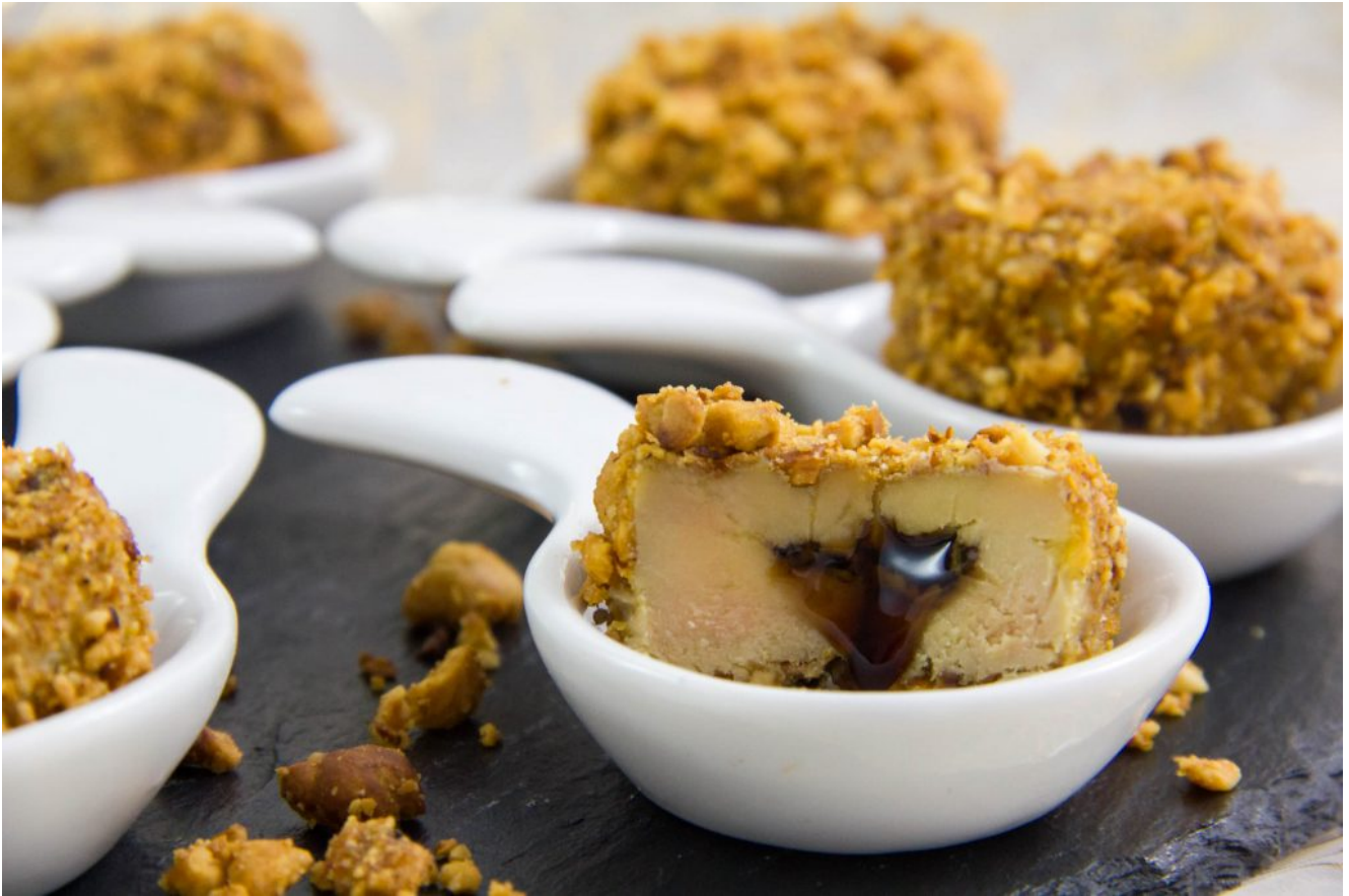
Bonbons de foie gras aux noisettes et cœur balsamique

Et voici la version du chef Massimo Bottura servie comme un petit esquimau.