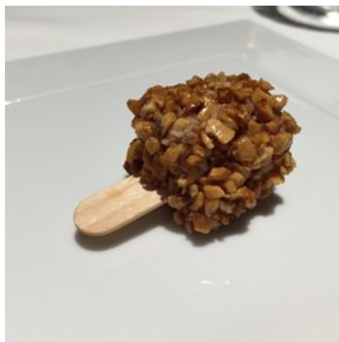
la version du chef Massimo Bottura

Et voici la version du chef Massimo Bottura servie comme un petit esquimau.