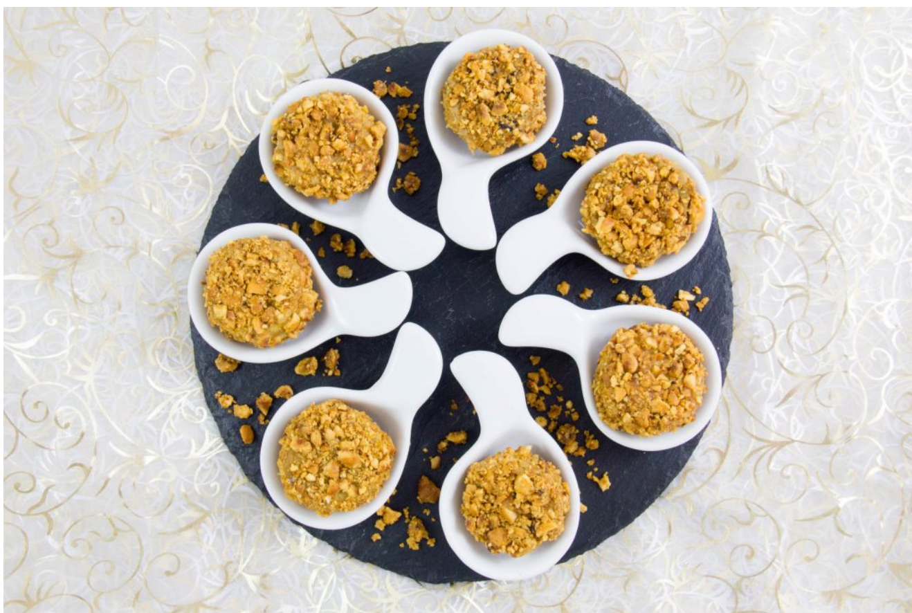
Bonbons de foie gras aux noisettes et cœur balsamique

Pour d'autres idées de recettes festives à base de foie gras: cliquez ici