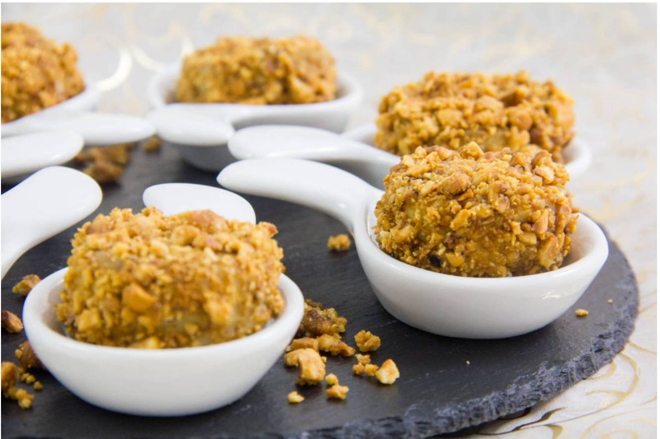
Bonbons de foie gras aux noisettes et cœur balsamique