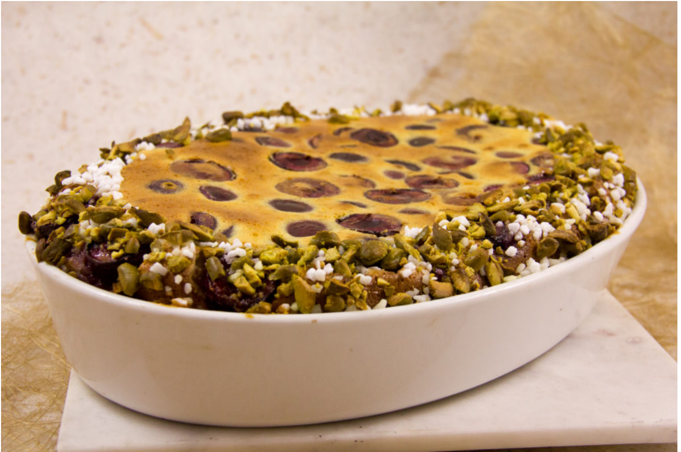
A la sortie du four