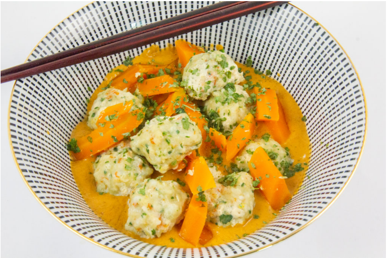
Bouchées aux crevettes et petits légumes (recette menu Thermomix)