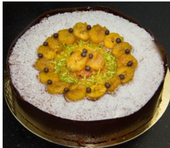
Bourdaloue à l'ananas

Comme beaucoup d'entre vous, je regarde « Le meilleur Pâtissier » avec Mercotte et Cyril Lignac. Dans la prochaine émission, une des épreuves portera sur les gâteaux aux fruits et en particulier une Bourdaloue à l'ananas. Je n'en ai pas la recette mais je me suis fait un plaisir que d'en imaginer une... Un sablé bien croustillant et caramélisé, une crème de noix de coco onctueuse et agrémentée de petits dés d'ananas acidulés, une jolie présentation... Et le résultat est délicieux! Voici donc ma version de la Bourdaloue à l'ananas.