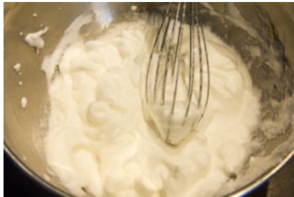
Montez la crème en chantilly

votre crème en beurre. Réservez la chantilly au frais.