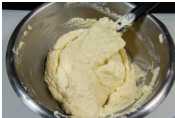
Ajoutez la chantilly