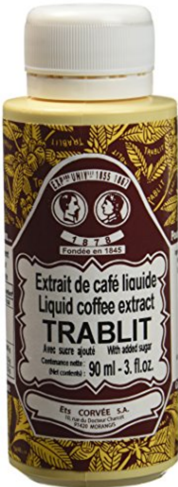
TRABLIT Extrait de Café Liquide 90 ml