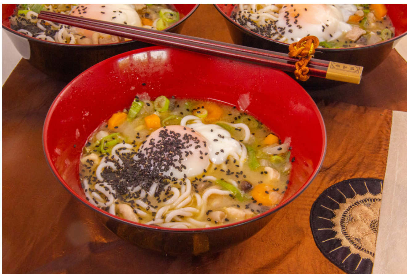
Butajiru ou soupe Japonaise et son Œuf Basse température

Pour plus d'informations sur la cuisson basse température cliquez ici .