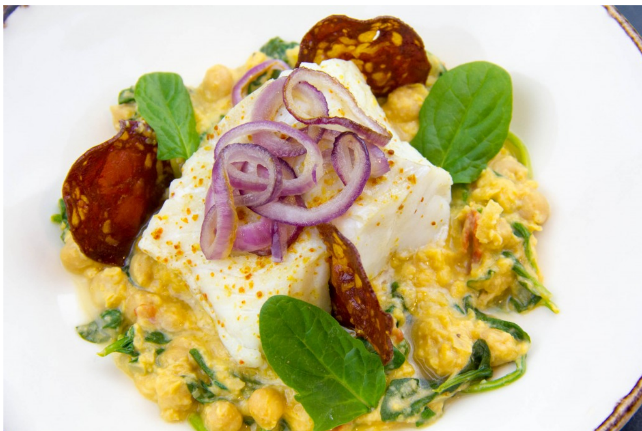
Cabillaud, purée de pois chiche et épinards au chorizo

Cette semaine je vous propose une recette facile de tous les jours que vous pourrez proposer également lors d'un repas plus élaboré car elle allie gourmandise et délicatesse. Les pois chiches et épinards amènent un côté original et sont merveilleusement relevés par le chorizo légèrement piquant.