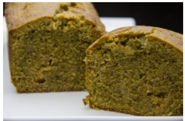
Cake au thé matcha et chocolat blanc