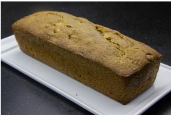
Cake au thé matcha et chocolat blanc