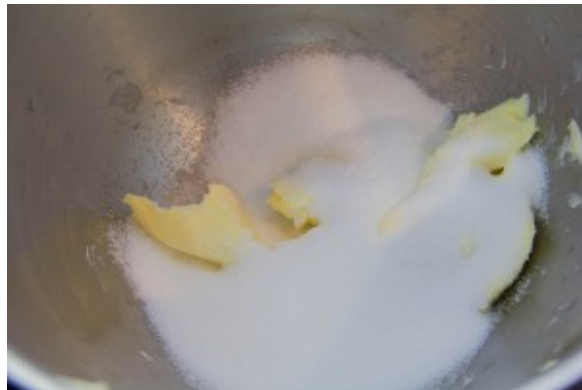
Fouettez le sucre et le beurre