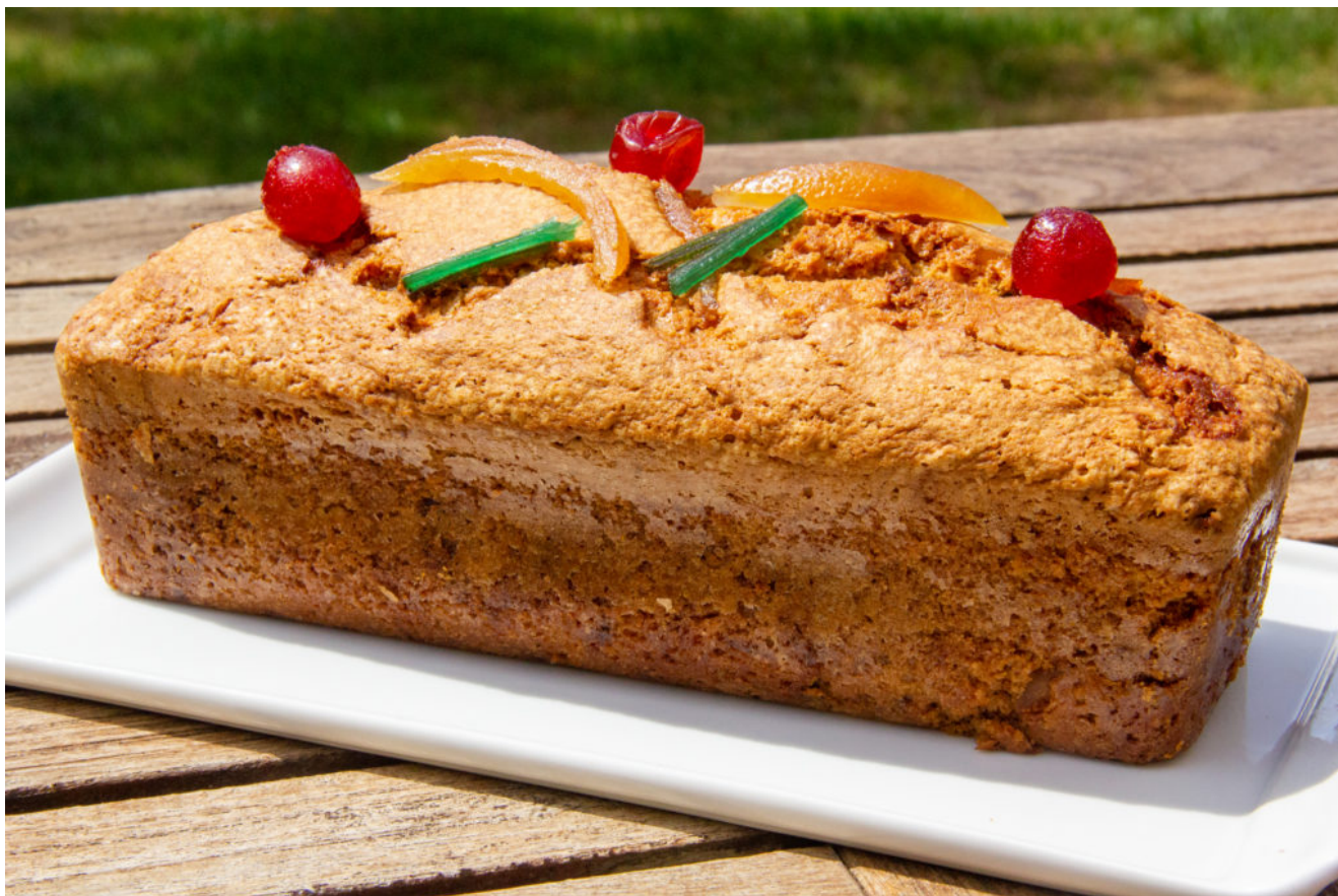
Cake aux fruits confits (recette Thermomix)

Un beau cake comme dans notre enfance pour une journée ensoleillée ou un bon goûter de la rentrée.. Surtout choisissez des fruits confits de qualité!