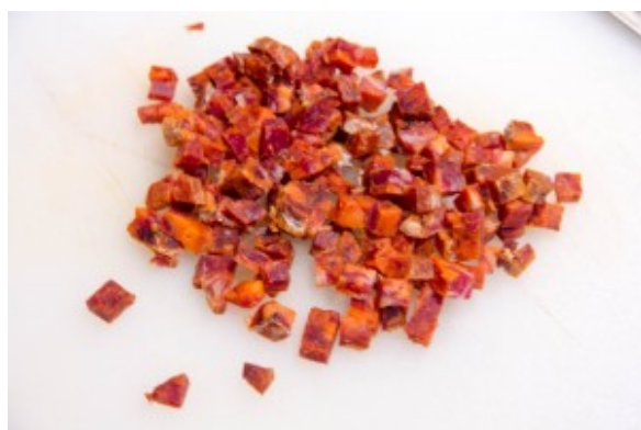
Coupez le chorizo en petits dés.