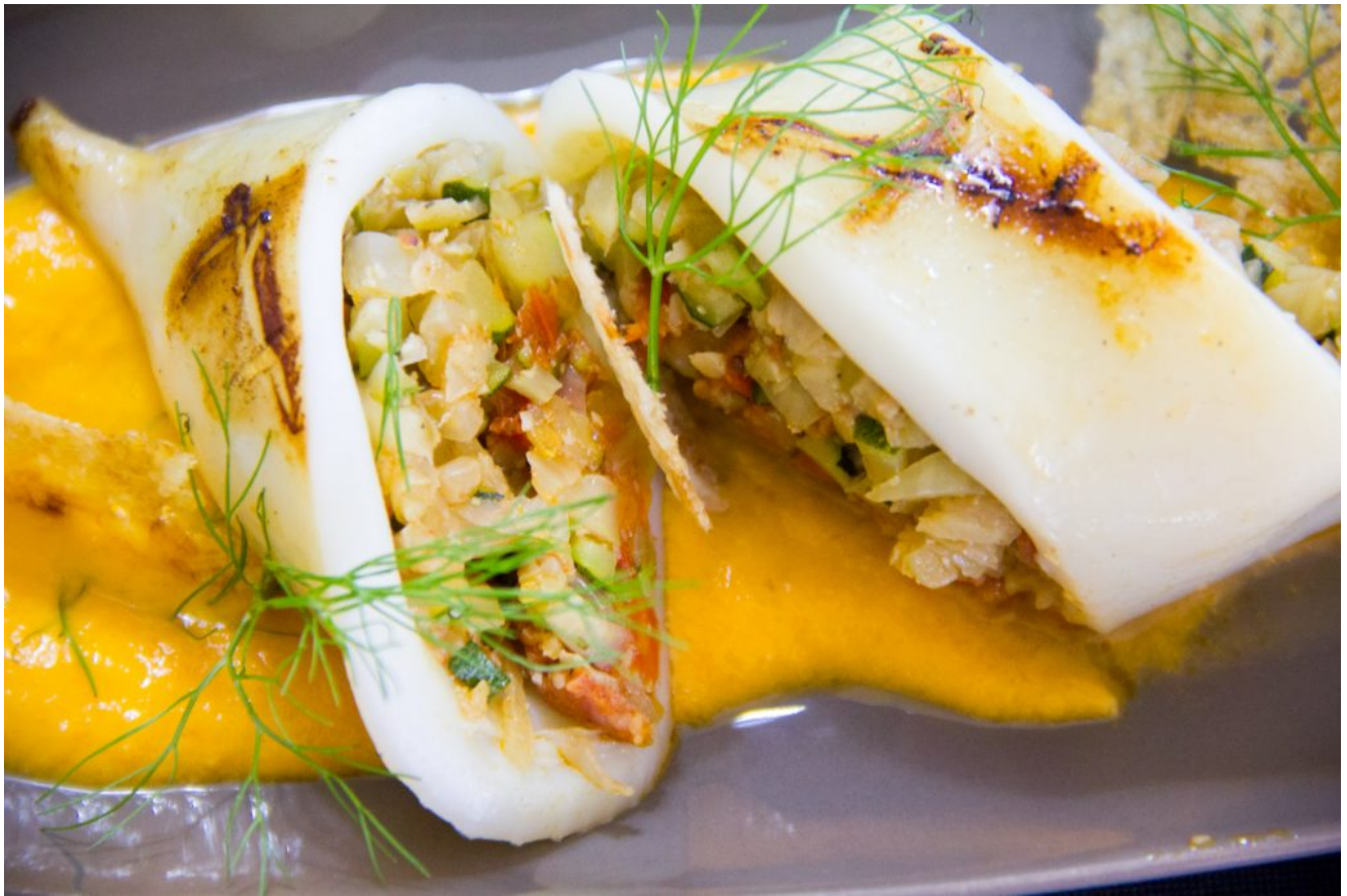
Calamars farcis aux légumes croquants, coulis de tomate acidulé et chips de riz