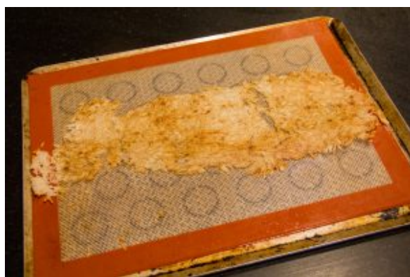
Chips de riz