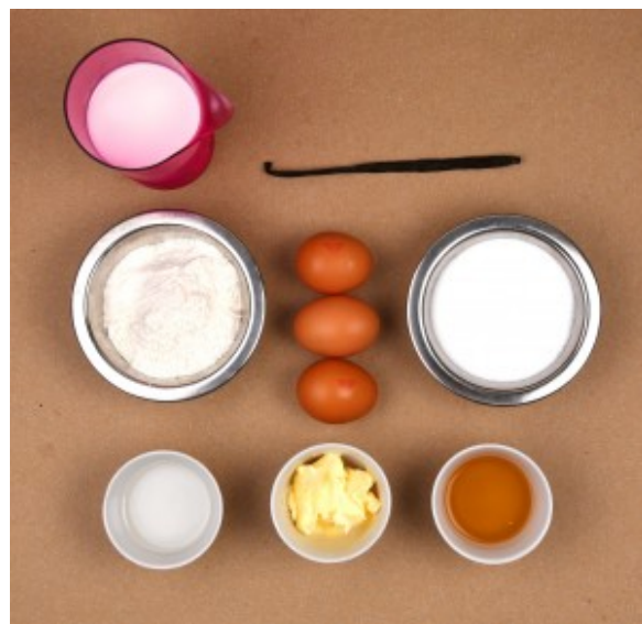
Ingrédients du canelé