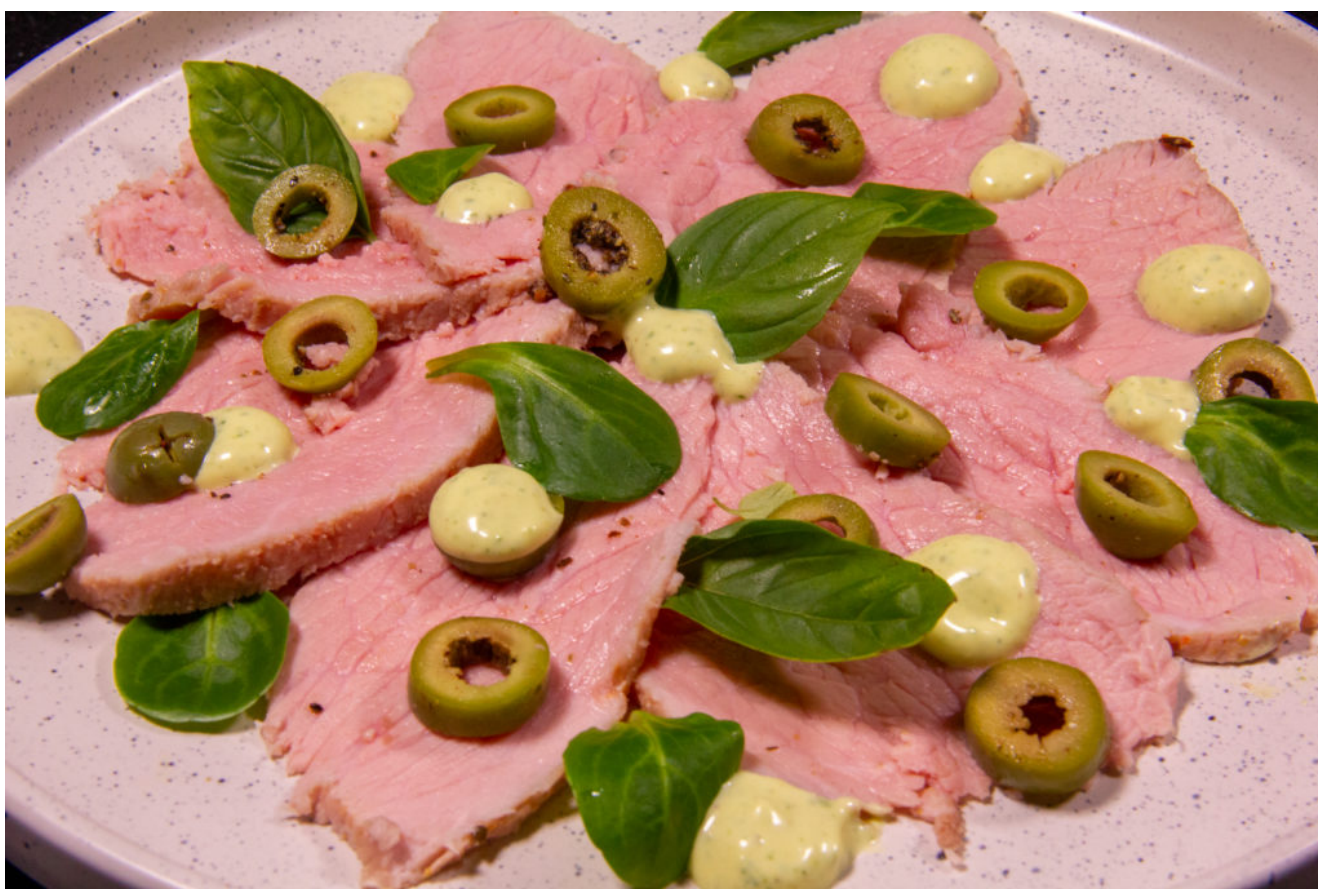
Carpaccio de veau aux olives et basilic thaïlandais (recette basse température)

Un délicieux carpaccio tout en tendreté et saveurs pour bien commencer l'été... grâce à la cuisson sous vide basse température!