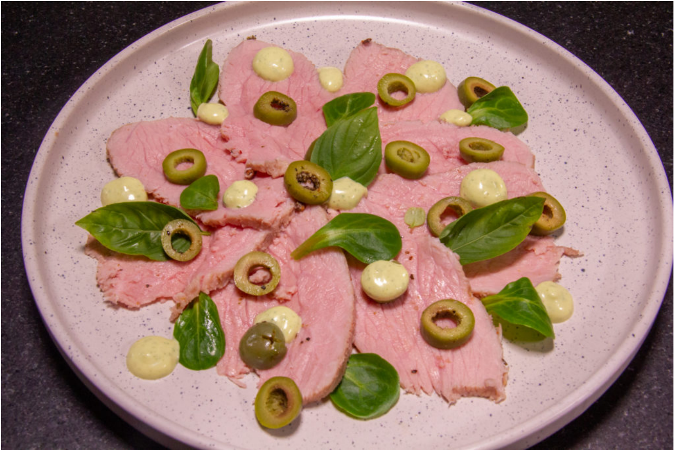
Carpaccio de veau aux olives et basilic thaïlandais (recette basse température)