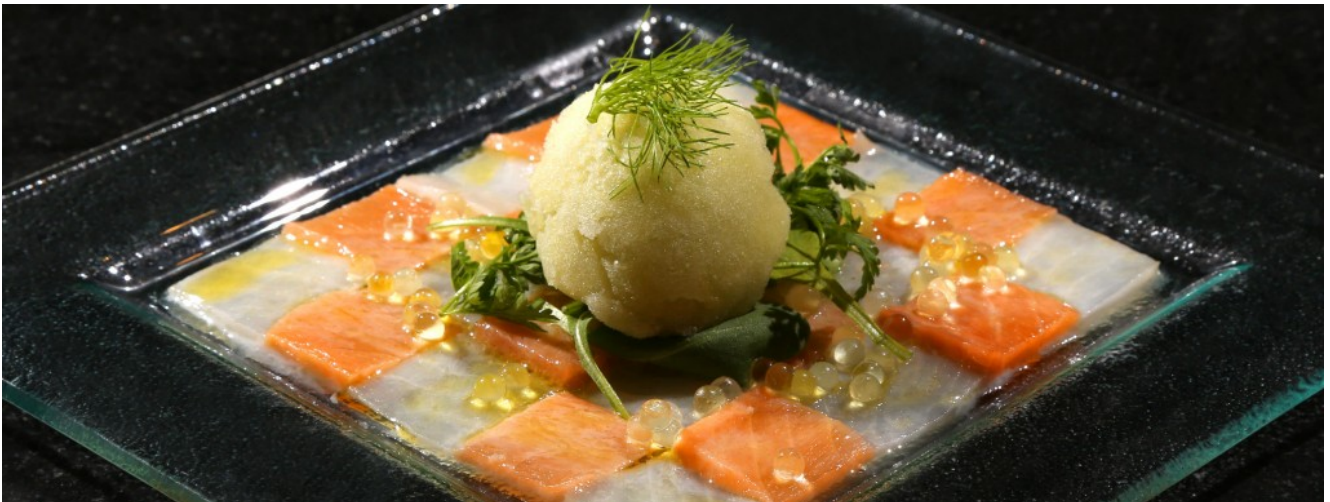
Carpaccio de saumon et cabillaud, perles de yuzu et sorbet fenouil

Beaucoup de fraîcheur dans cette entrée classique mais rehaussée par le très parfumé et étonnant sorbet au fenouil qui se marie parfaitement avec le poisson. La préparation d'une partie des ingrédients de cette recette se fait la veille en raison du passage en congélation ou du temps d'infusion.