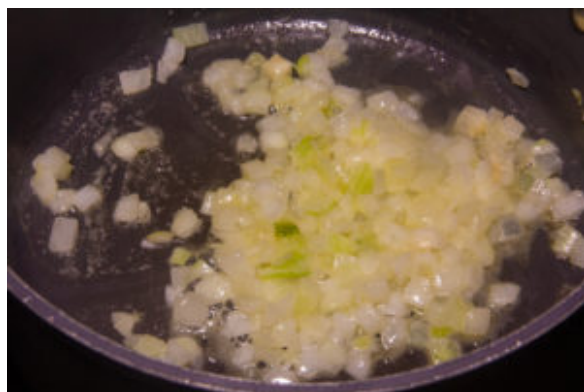
Faites revenir l'oignon avec un peu de beurre