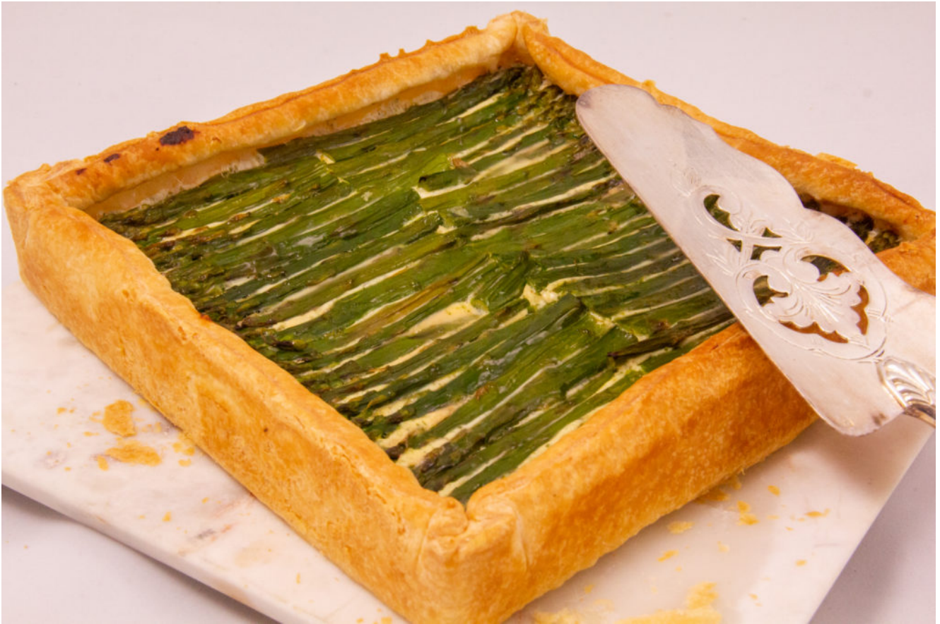
Tarte estivale aux asperges