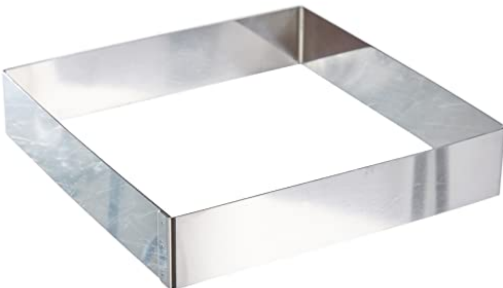
Lacor 68240 Cercle Carre pour Pâtisserie 20 X 20 cm