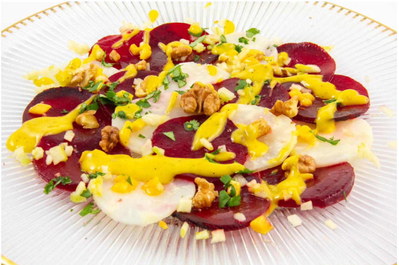
Carpaccio fruité betterave et céleri (recette Basse température)

Pour plus de renseignements sur la cuisine sous vide basse température cliquez ici .