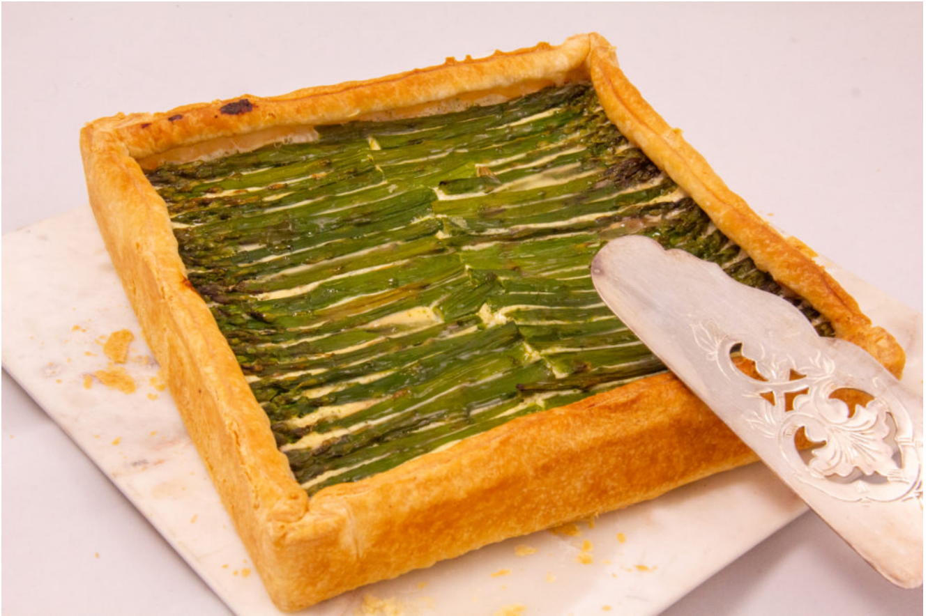
Tarte estivale aux asperges