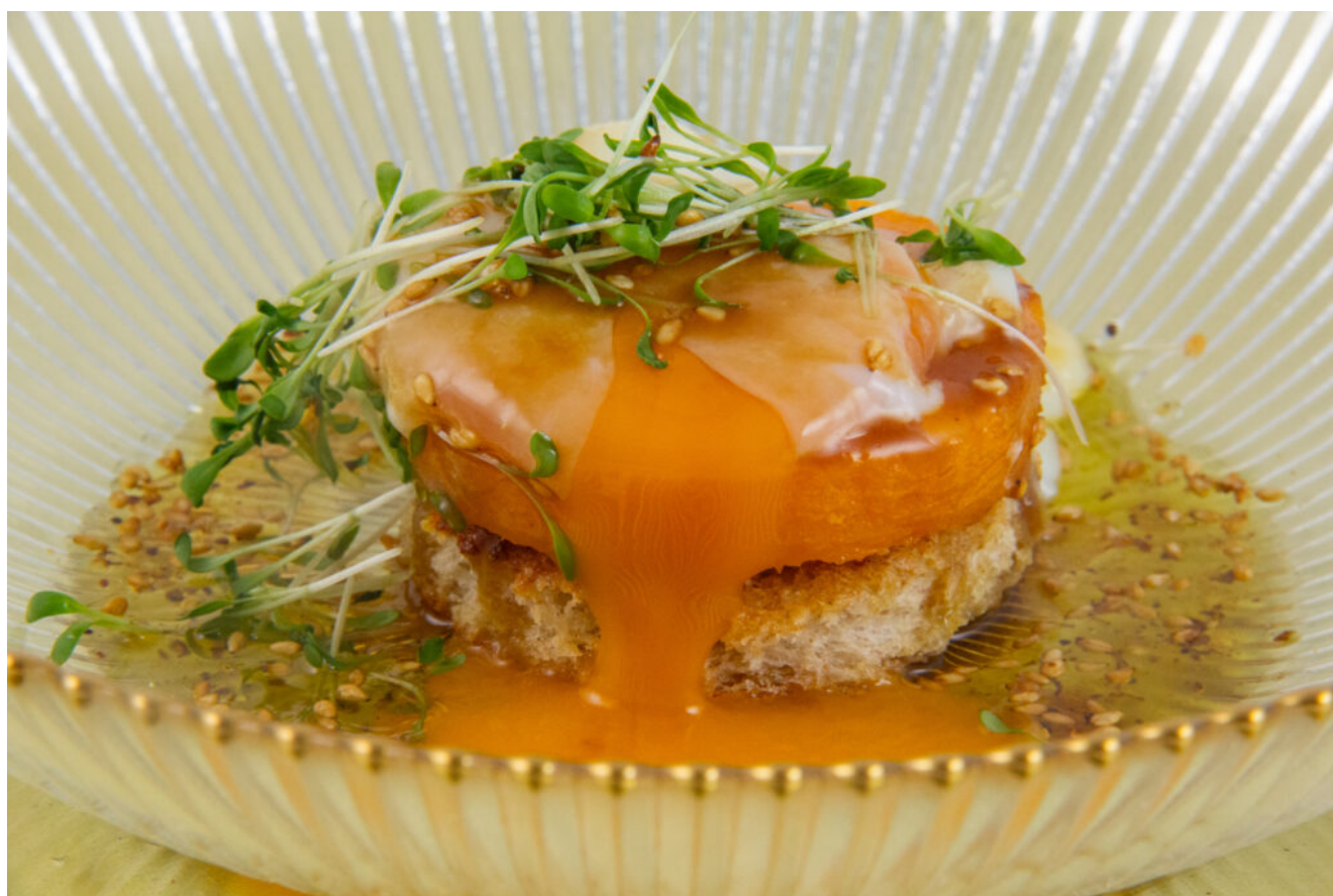
Œuf d'hiver parfait basse température

Cette recette d'Œuf d'hiver basse température m'a été inspirée par une recette du chef Alain Passard. Dans cette recette le chef cuisine l'œuf au plat plutôt que basse température: en fait vous pouvez cuisiner l'œuf comme bon vous semble: basse température, au plat, poché...Mais avec la cuisson basse température votre jaune sera ultra crémeux et tellement bon; il se mariera avec volupté à la vinaigrette pour sublimer le butternut !