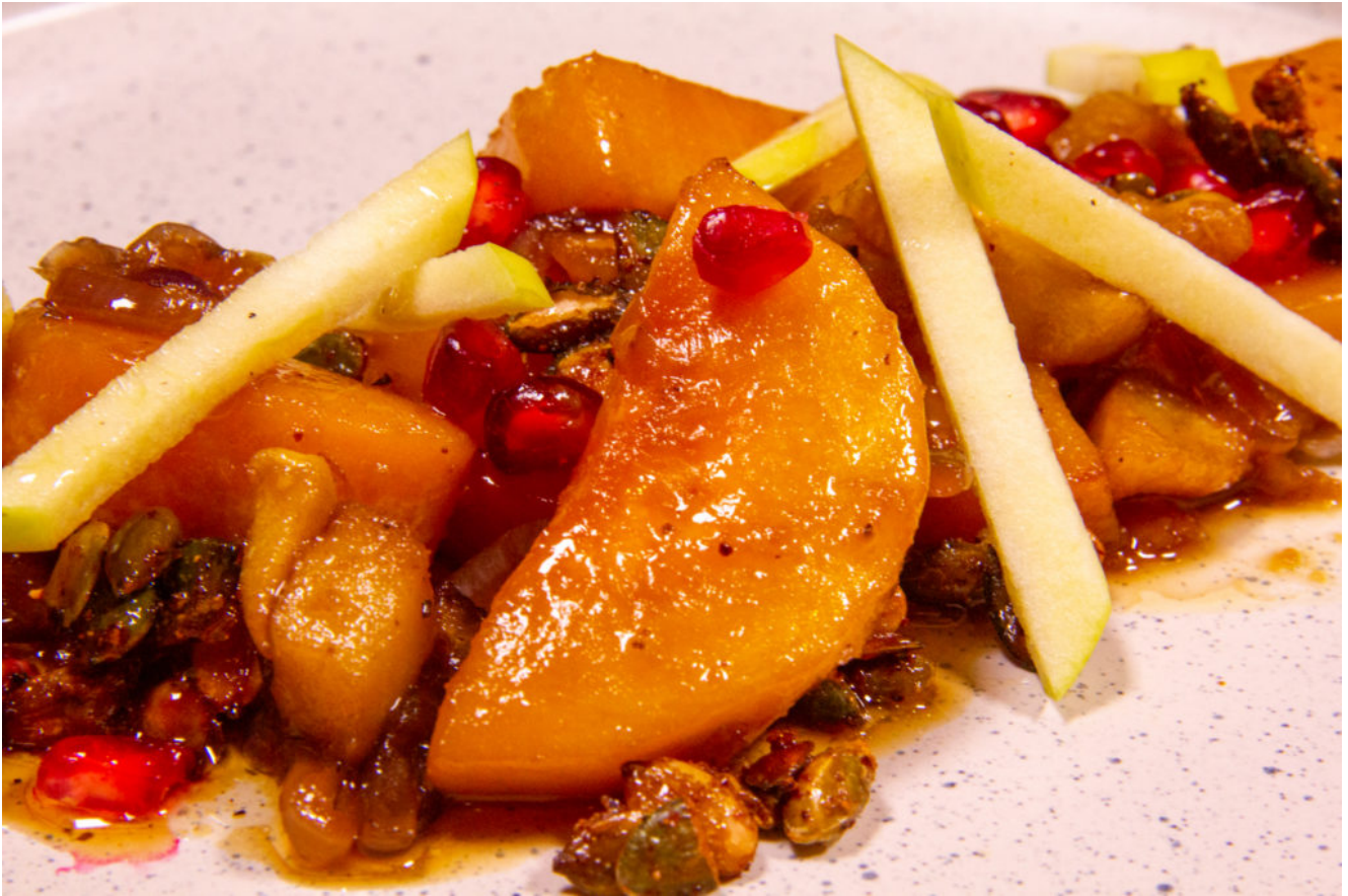
Butternut rôti en salade