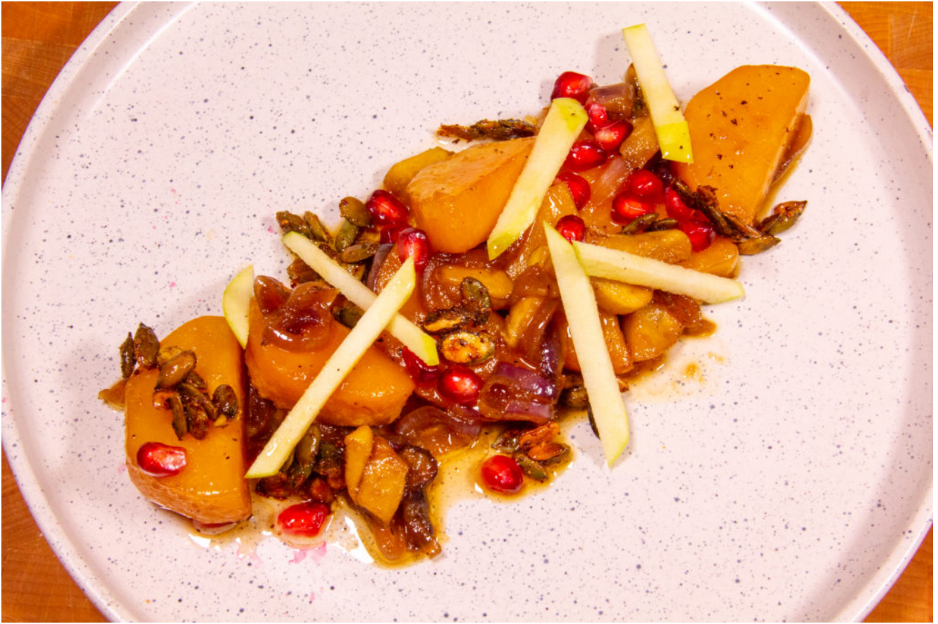
Butternut rôti en salade