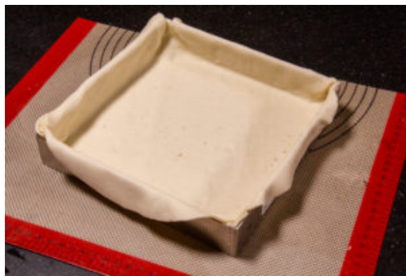
Foncez votre cercle à tarte