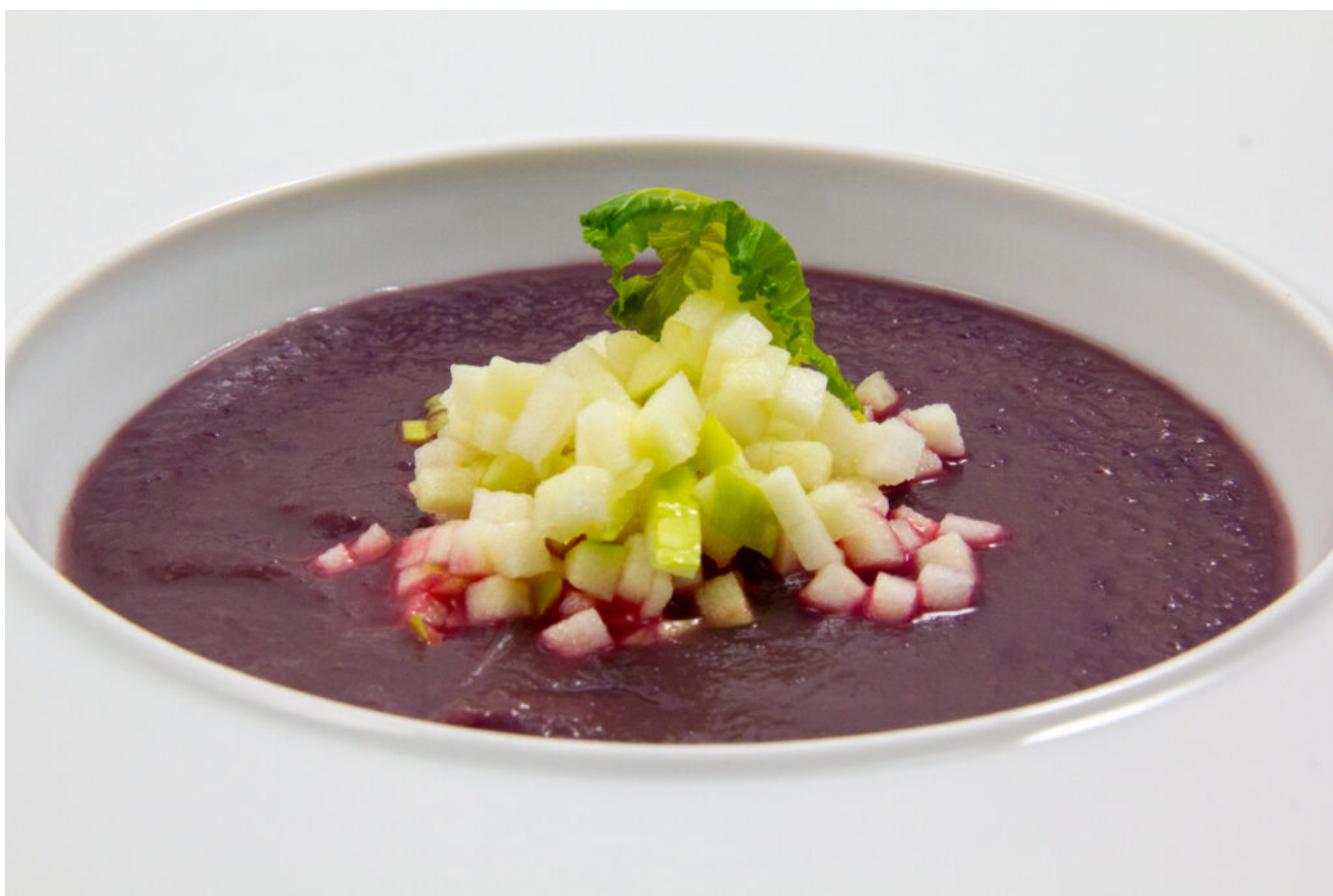
Velouté chou rouge et pommes

Pour la recette au Thermomix cliquez ici .