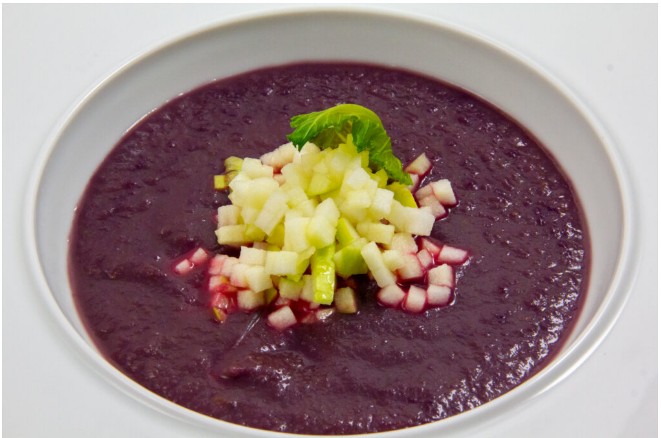
Velouté chou rouge et pommes