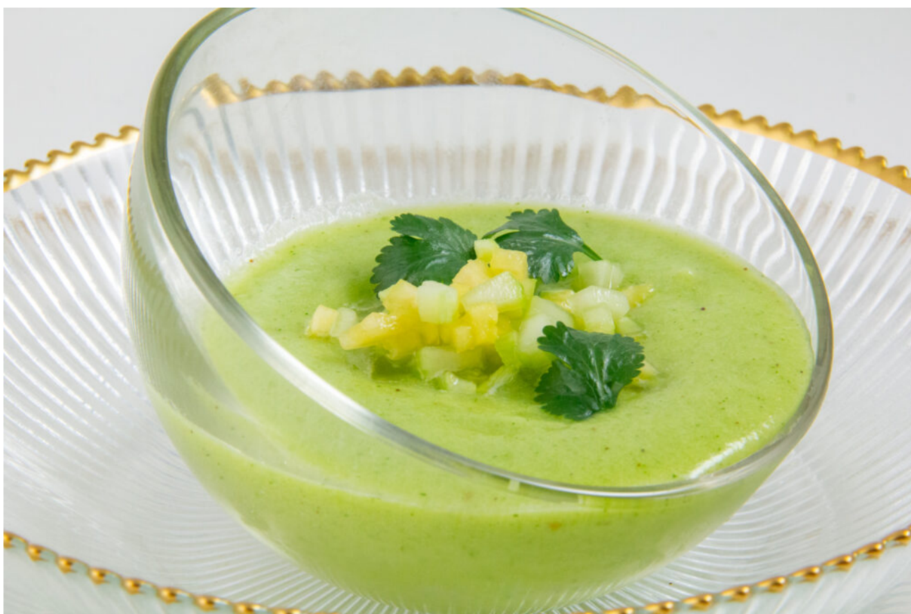
Gaspacho Fraicheur concombre ananas

Pour la recette au Thermomix cliquez ici .