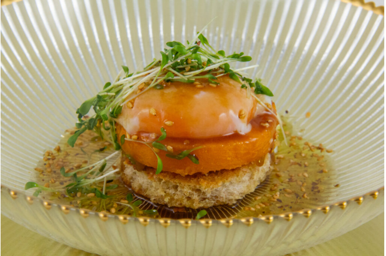
Œuf d'hiver parfait basse température

tranche de butternut et placez l'œuf. par dessus. Nappez avec le jus de poulet réduit. Versez un peu de vinaigrette au soja tout autour et ajoutez les petites pousses.