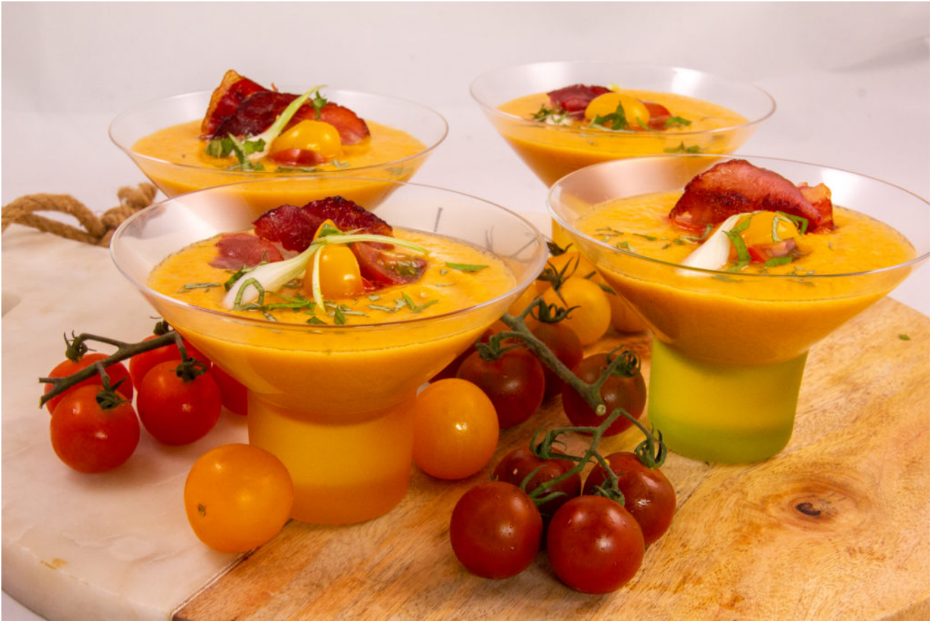
Gaspacho melon concombres