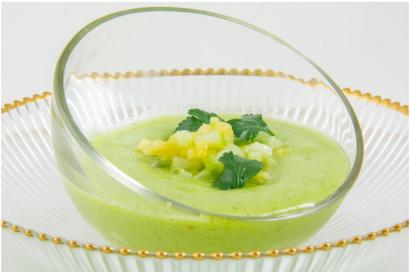
Gaspacho Fraicheur concombre ananas