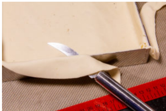
A l'aide d'un couteau coupez le trop plein de pâte