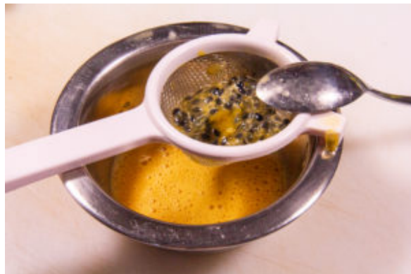
Passez la chair des fruits de la passion au tamis