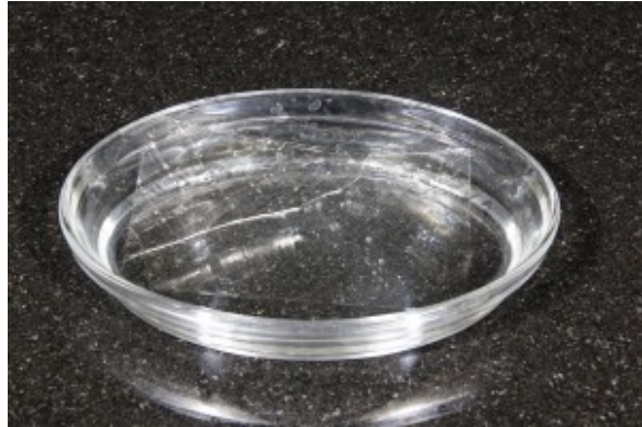
Mouillez la gélatine