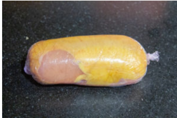
Un joli boudin bien serré