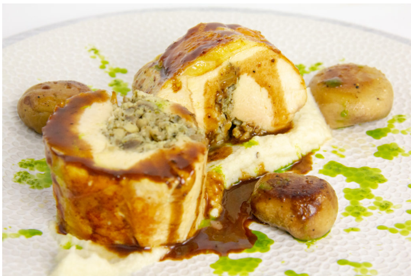
Chapon farci aux champignons, mousseline de chou fleur

Vous devez commencer la sauce la veille afin de bien la dégraisser et vous pouvez également farcir et mettre sous vide les blancs de chapon. Vous terminerez la garniture et la cuisson du chapon le jour même.