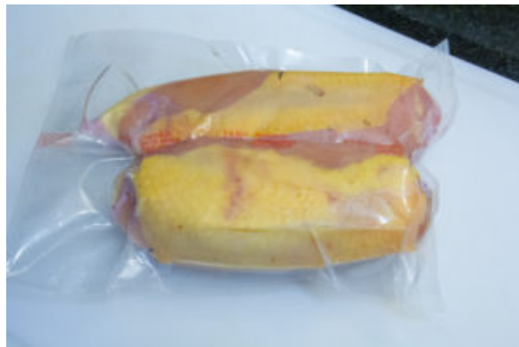
Mettez les blancs sous vide