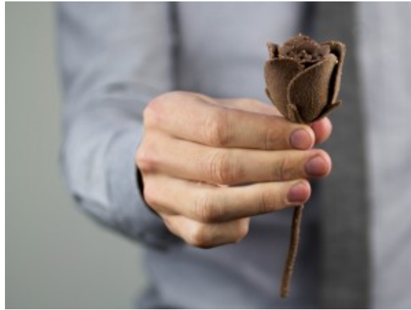
rose en sucre et chocolat

Les imprimantes sont encore en cours de développement avec un lancement prévu dans la seconde moitié de 2014. Deux modèles seront disponibles, une imprimante monochrome avec une chambre de construction 8x8x6 pouces pour moins de 5000 $ et une chambre de construction 10x14x8 pouces en couleur pour moins de $ 10,000.