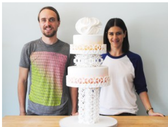
Décors en sucre

Puis à l'occasion d'une fête d'anniversaire ils ont eu l'idée de fabriquer des décorations en sucre pour le gâteau à l'aide d'une imprimante 3d. Ils ont donc expérimenté différents types de sucres et finalement développé cette imprimante particulière. Leurs réalisations sont vraiment bluffantes!