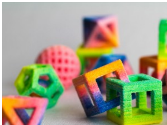
construction de sucre en 3D

ChefJet système 3D est la seule machine du genre qui peut imprimer en trois dimensions des formes particulièrement compliquées: elle peut produire des bonbons, des décorations de gâteau et des confiseries et tout cela en couleur . La seule limitation, outre celle de votre imagination, est la chambre de construction , qui peut contenir l'équivalent de 4200 morceaux de sucre.