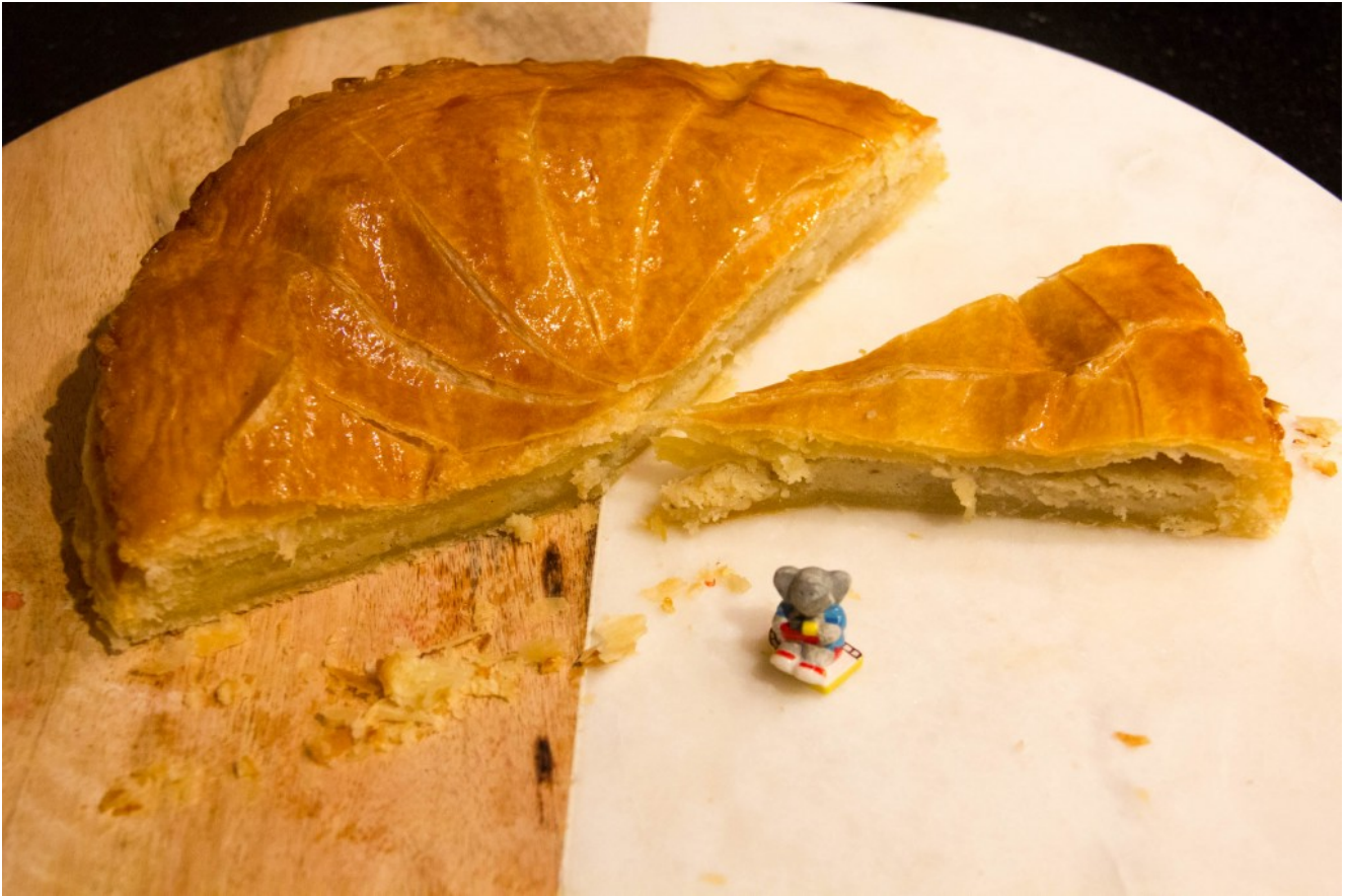
Galette des rois