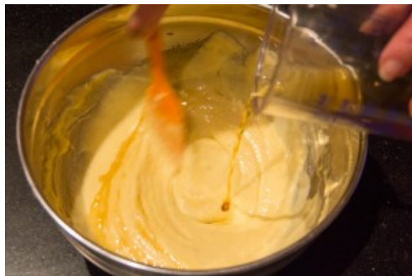
Ajoutez les 100 g de crème