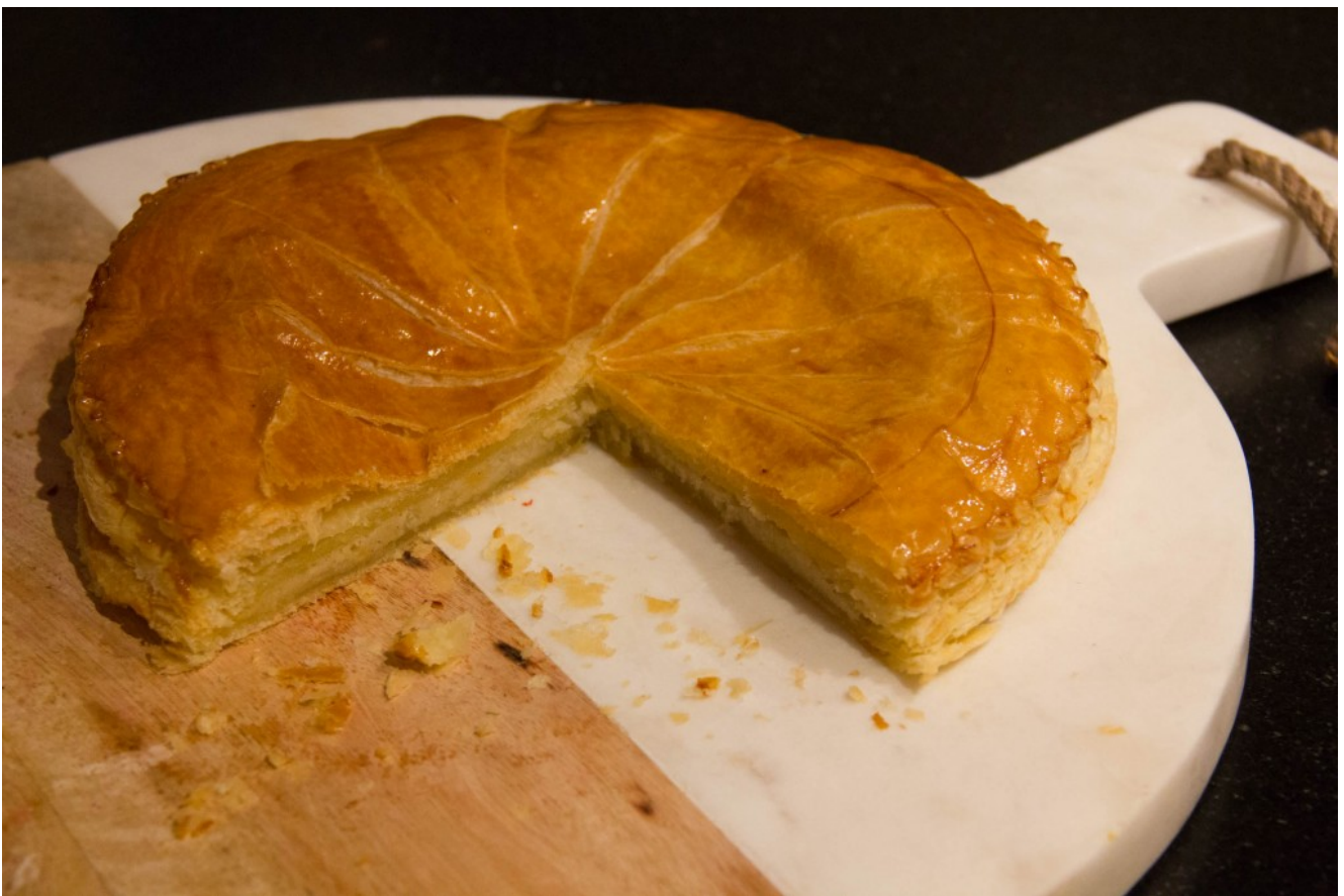
Galette des rois

La galette est finie!!! Régalez vous. Vous verrez que tous vos efforts seront récompensés.