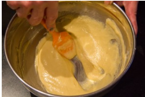
Bien mélanger avec une spatule