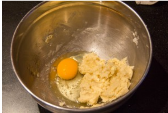
Ajoutez l'œuf entier