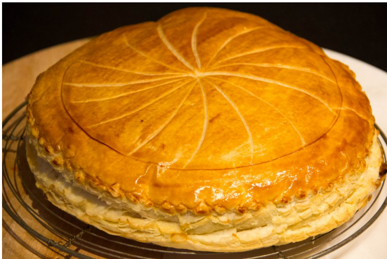
Galette des rois

Si vous aimez le chocolat optez pour Ma gourmande galette des rois au chocolat et noisettes croquantes . La recette en cliquant ici .