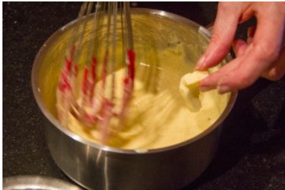
rajoutez les parcelles de beurre