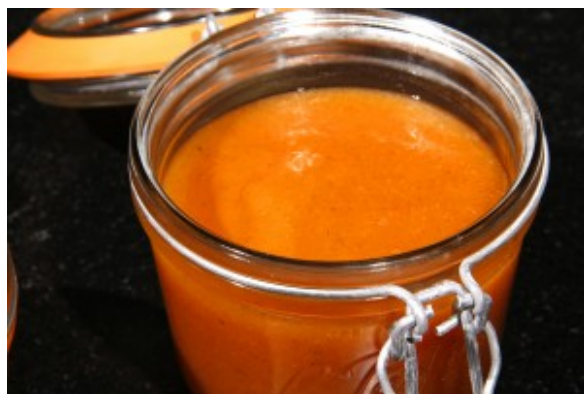
Confiture exotique au parfum de fraise

D'autre part n'oubliez pas que faire sa confiture est un jeu d'enfant. Il serait dommage de s'en priver, plutôt que d'acheter des confitures du commerce pour lesquelles on vous fait payer l'eau et le sucre au prix des fruits! Sans compter les colorants et autres conservateurs.