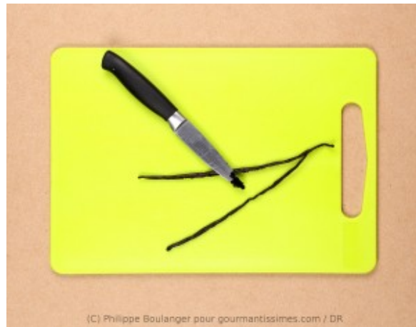
gratter la gousse de vanille