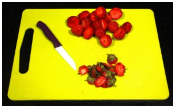
Équeutez les fraises