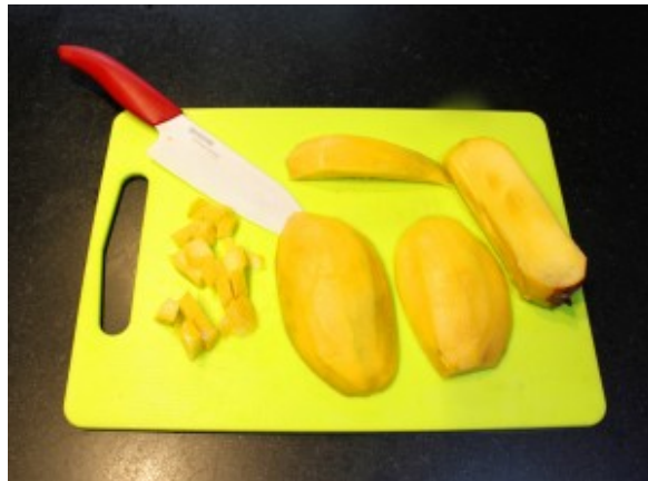
Coupez la mangue en cubes