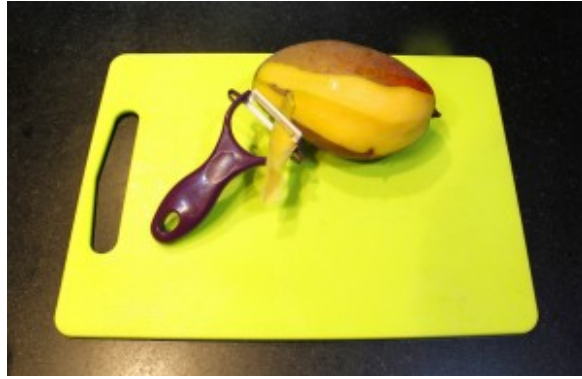
Épluchez la mangue