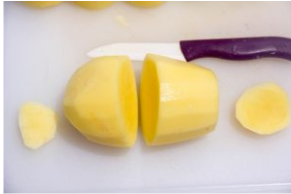
Taillez les pommes de terre