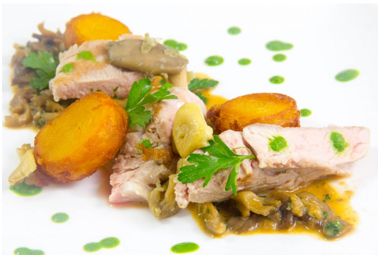
Côte de veau cuite basse température, sauce forestière et pommes de terre croustillantes (Les carnets de Julie)

Voici la vidéo de la recette dans l'émission: