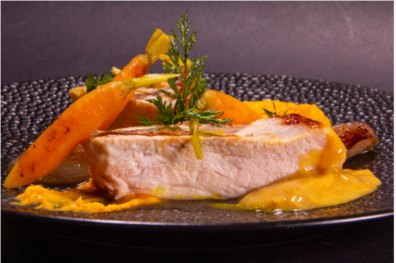
Côtes de porc aux carottes, sauce orange et miso (Recette Basse température)