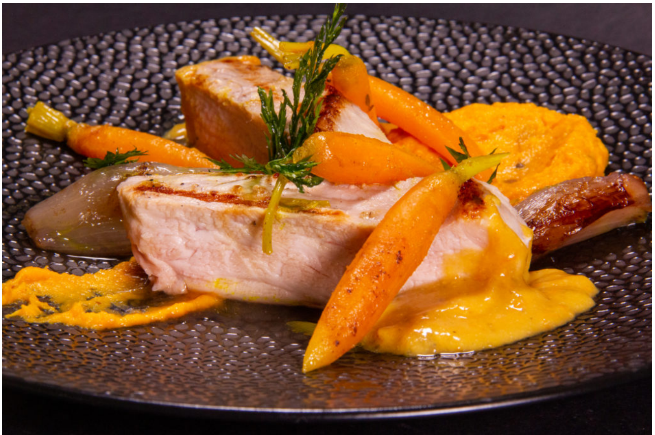
Côtes de porc basse température, carotte et sauce orange et miso (recette basse température)

Le porc est une viande à qui la cuisson sous vide basse température amène énormément de tendreté. Je l'ai cuisiné aujourd'hui avec une déclinaison de carotte et une touche sucré orangée.