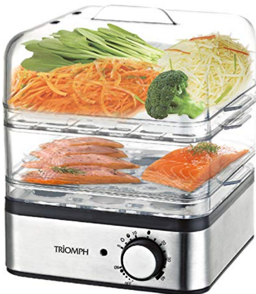
Triumph ETF1575 Cuiseur Vapeur Inox 400 W