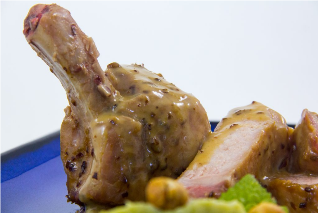
Côtes de porc Ibérico basse température, sauce pruneaux et déclinaison de choux aux noisettes