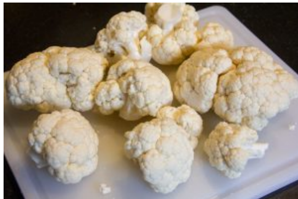
Détaillez le chou fleur blanc en petites "florettes"