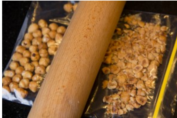
Écrasez les noisettes

noisettes dans un sac plastique et écrasez-les grossièrement à l'aide d'un rouleau à pâtisserie. Réservez.