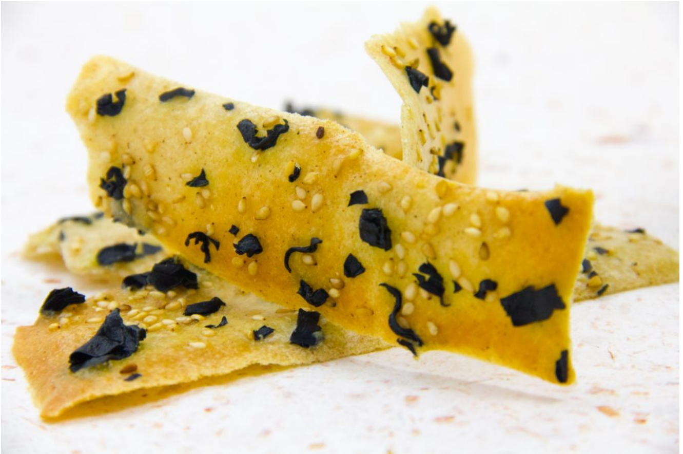
Crackers croustillants aux algues et sésame