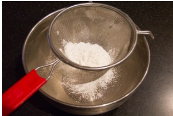
Tamisez les farines