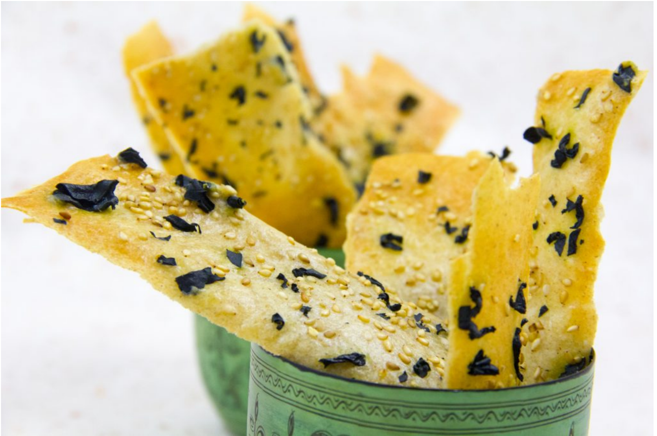
Crackers croustillants aux algues et sésame