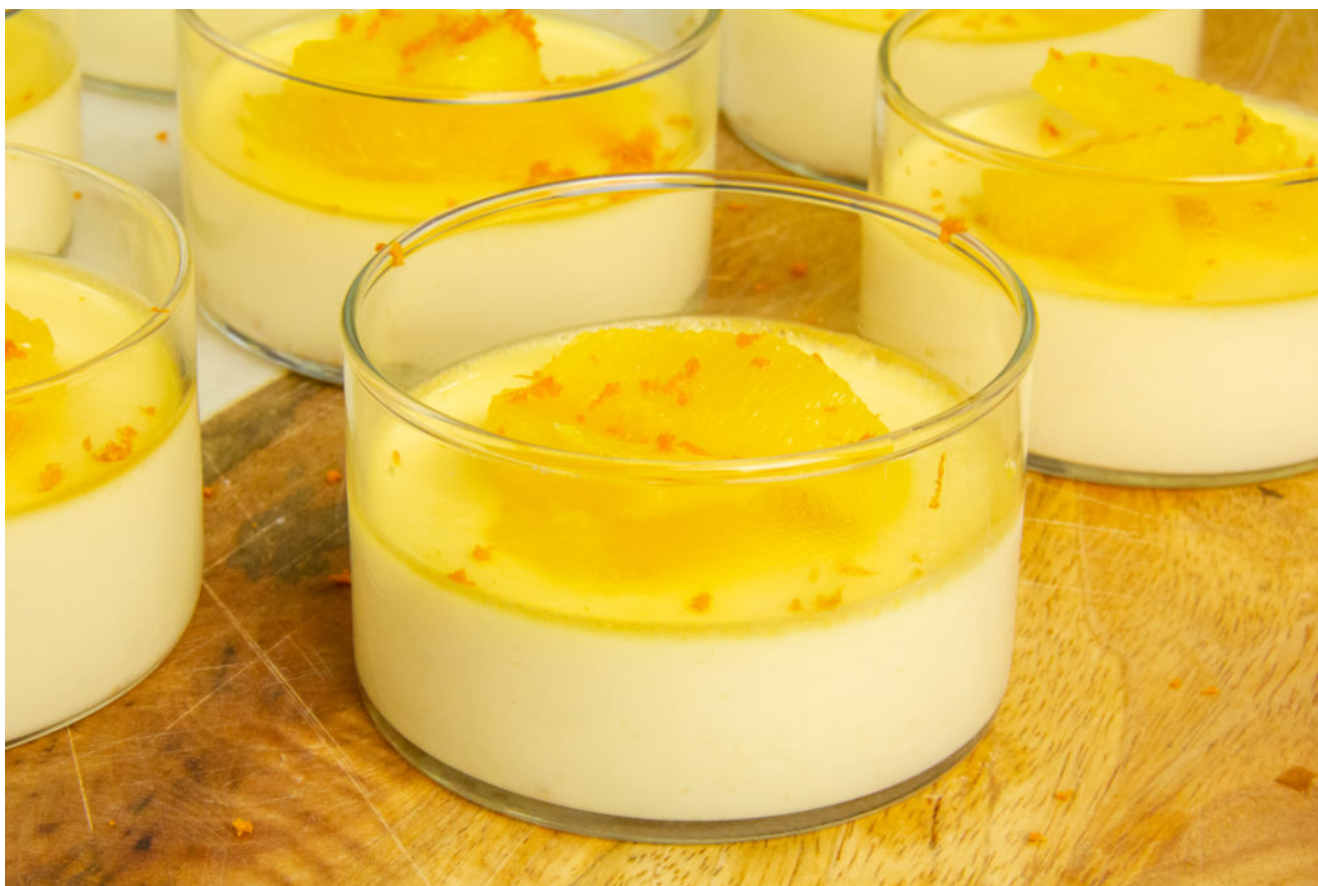
Crème à l'orange