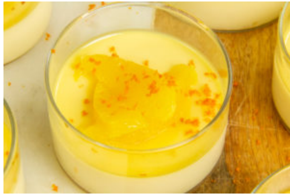
Crème à l'orange