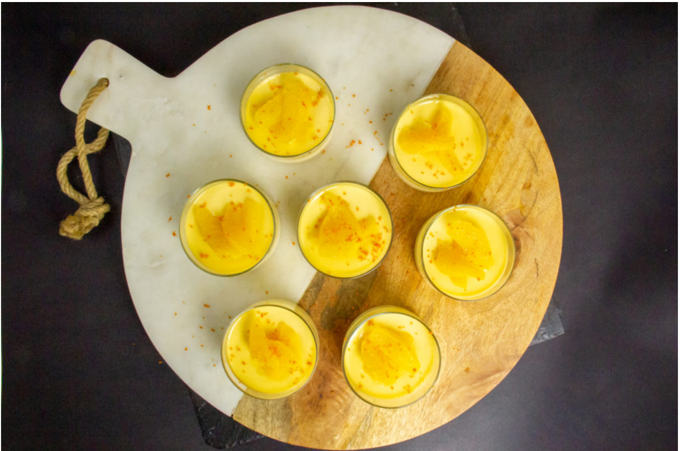
Crème à l'orange