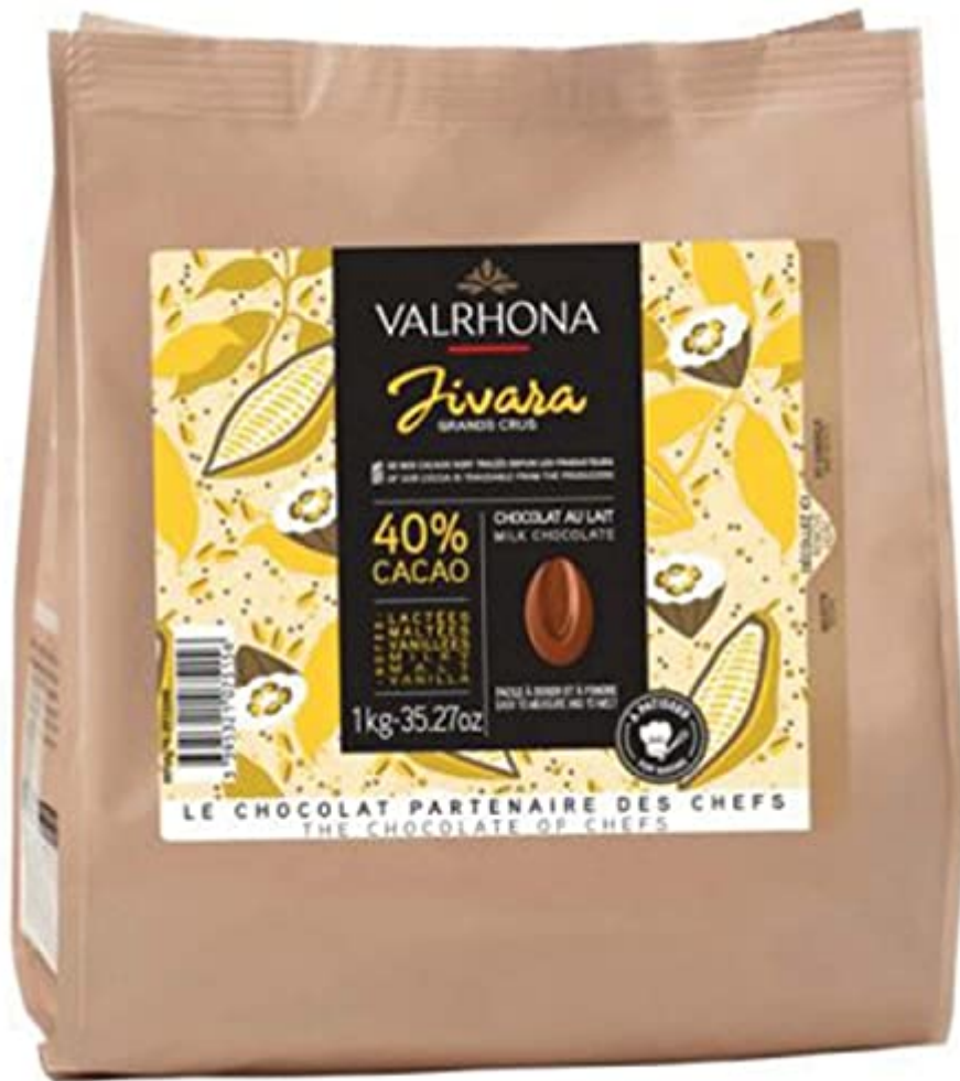
Valrhona - Fèves chocolat lait Valrhona jivara 1kg

de la marque Valrhona. vous pouvez en trouver en cliquant sur la photo ci-dessous.