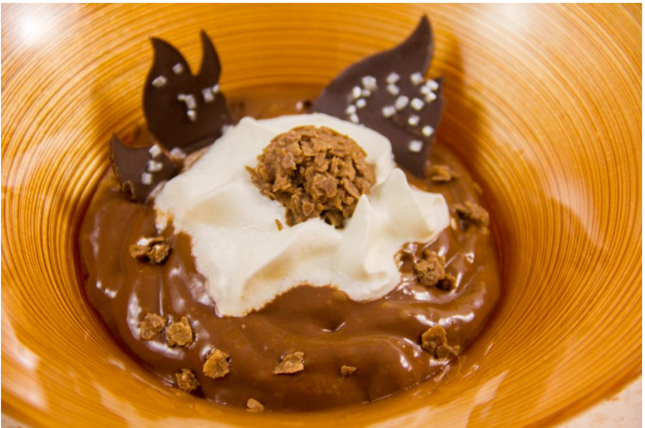
Crème aérienne au chocolat et ses pépites croustillantes