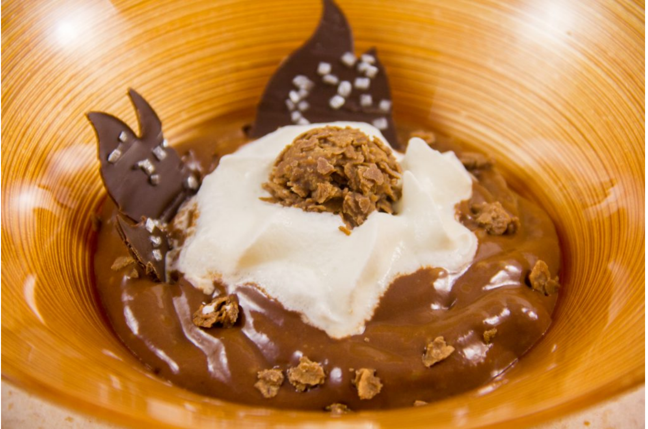
Crème aérienne au chocolat et ses pépites croustillantes

de pépites croustillantes. Décorez avec vos décoration en chocolat, des petites billes de meringue chocolatées, une langue de chat...C'est un petit bonheur de gourmandise!