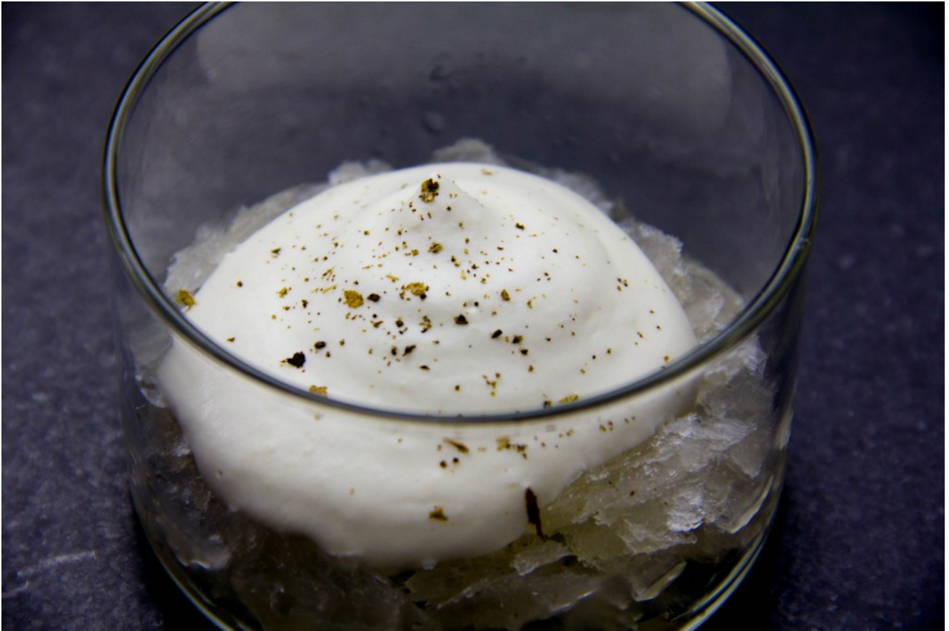
Crème de gorgonzola, granité au champagne