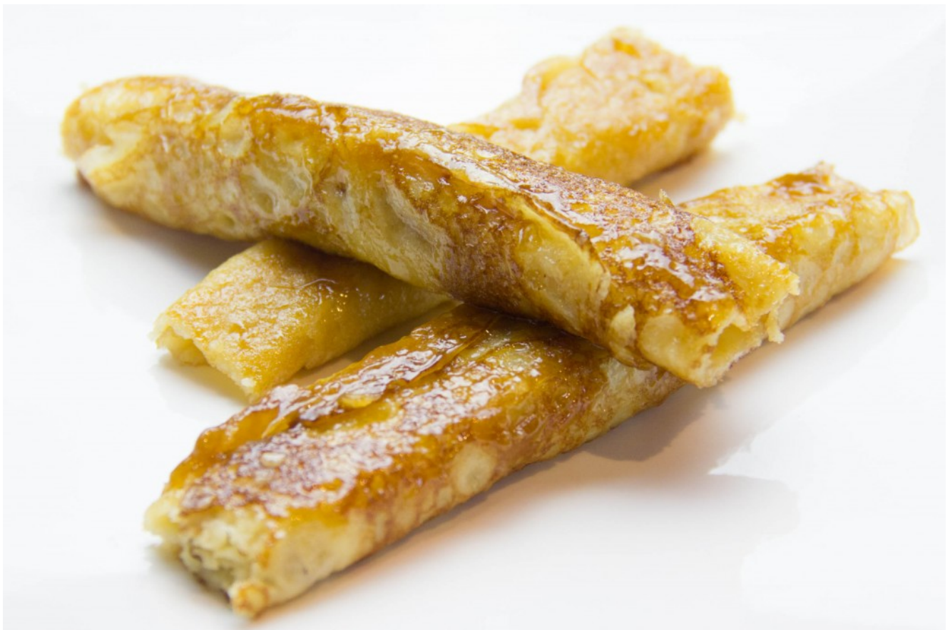
Crêpes caramélisées à la fleur d'oranger de Philippe Conticini