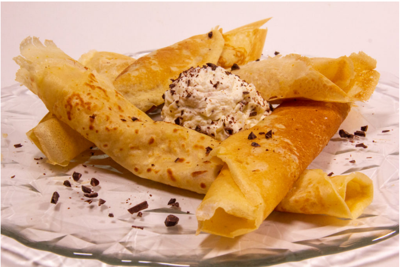
Crêpes orange et chocolat

Demain la chandeleur! Réalisez grâce à votre TM6 de délicieuses crêpes parfumées aux agrumes et servies avec une chantilly orange et pépites de chocolat... Une véritable gourmandise qui va régaler toute la famille.