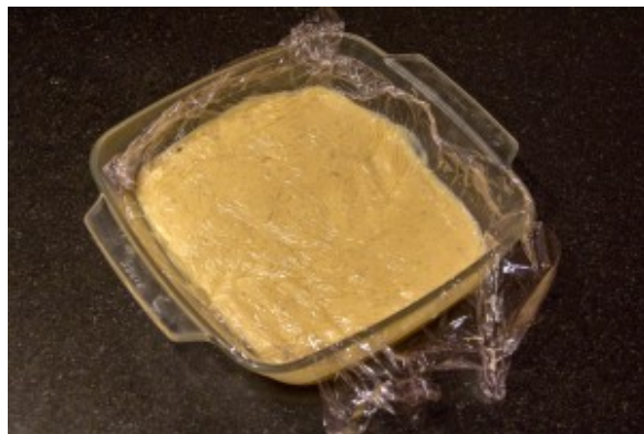
Versez dans un grand plat, filmez au contact