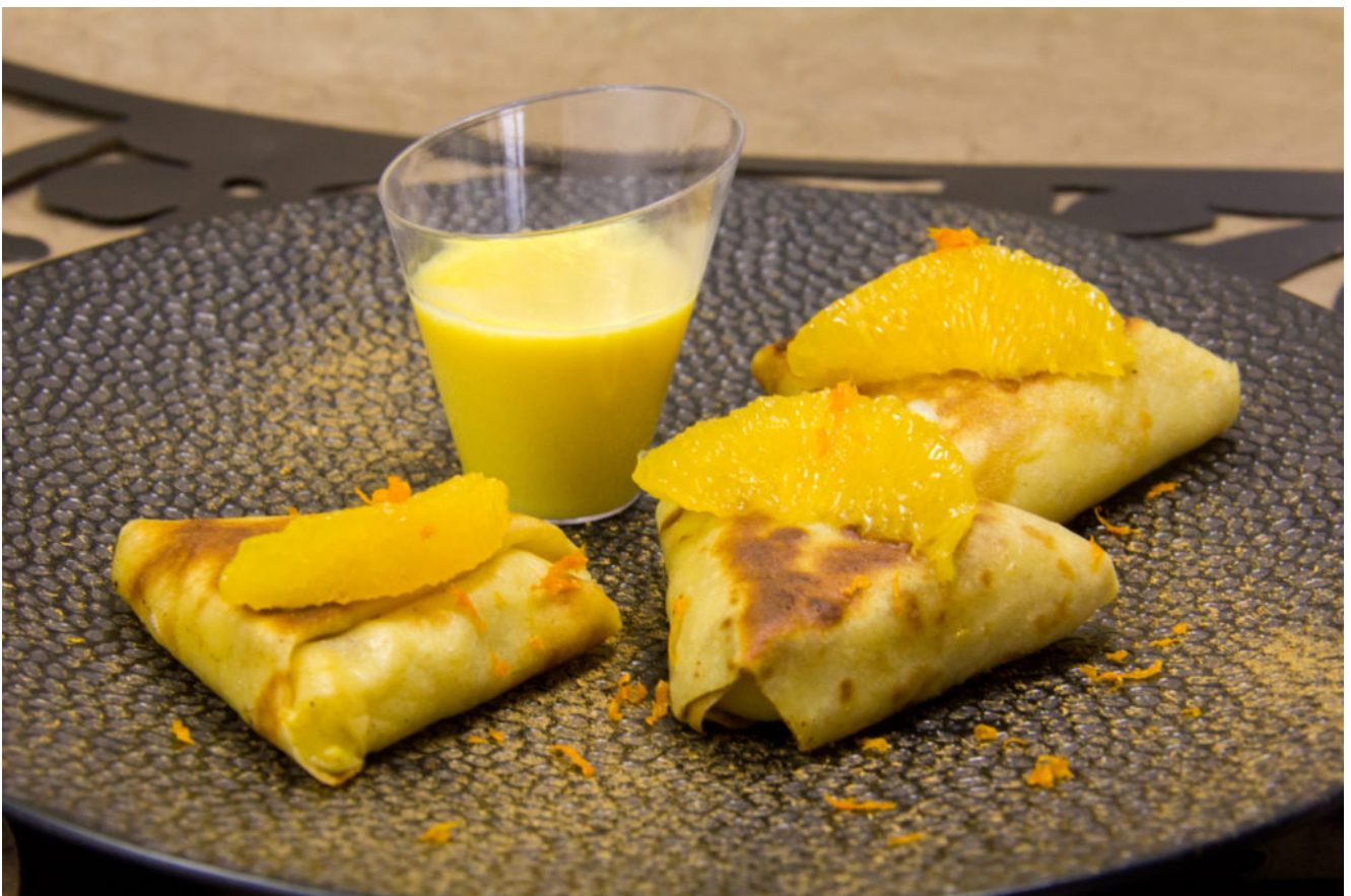
Crêpes Suzette revisitées