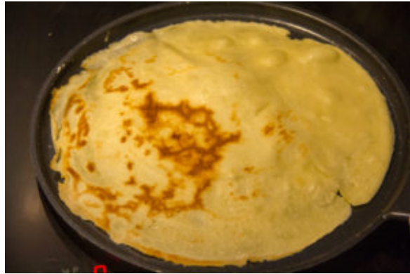
Cuisson des crêpes