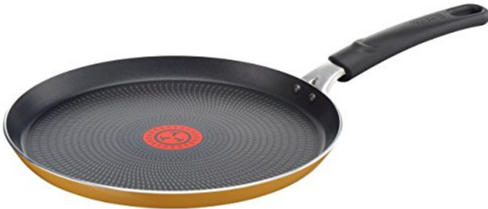
Tefal B3421002 Crêpière, Aluminium, Jaune, 25 cm