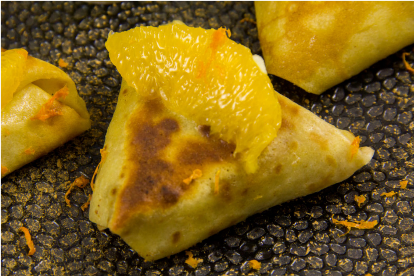
Crêpes Suzette revisitées