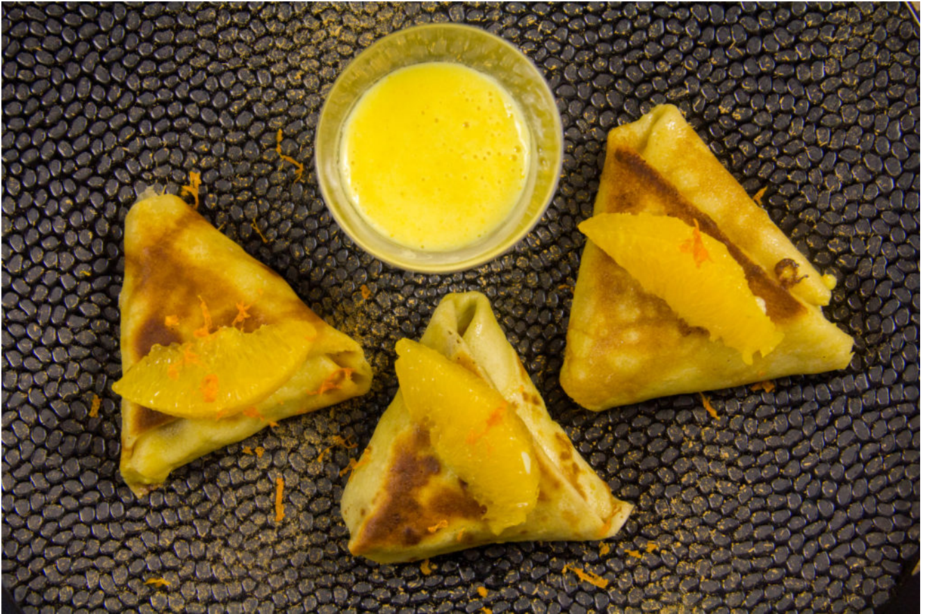
Crêpes Suzette revisitées