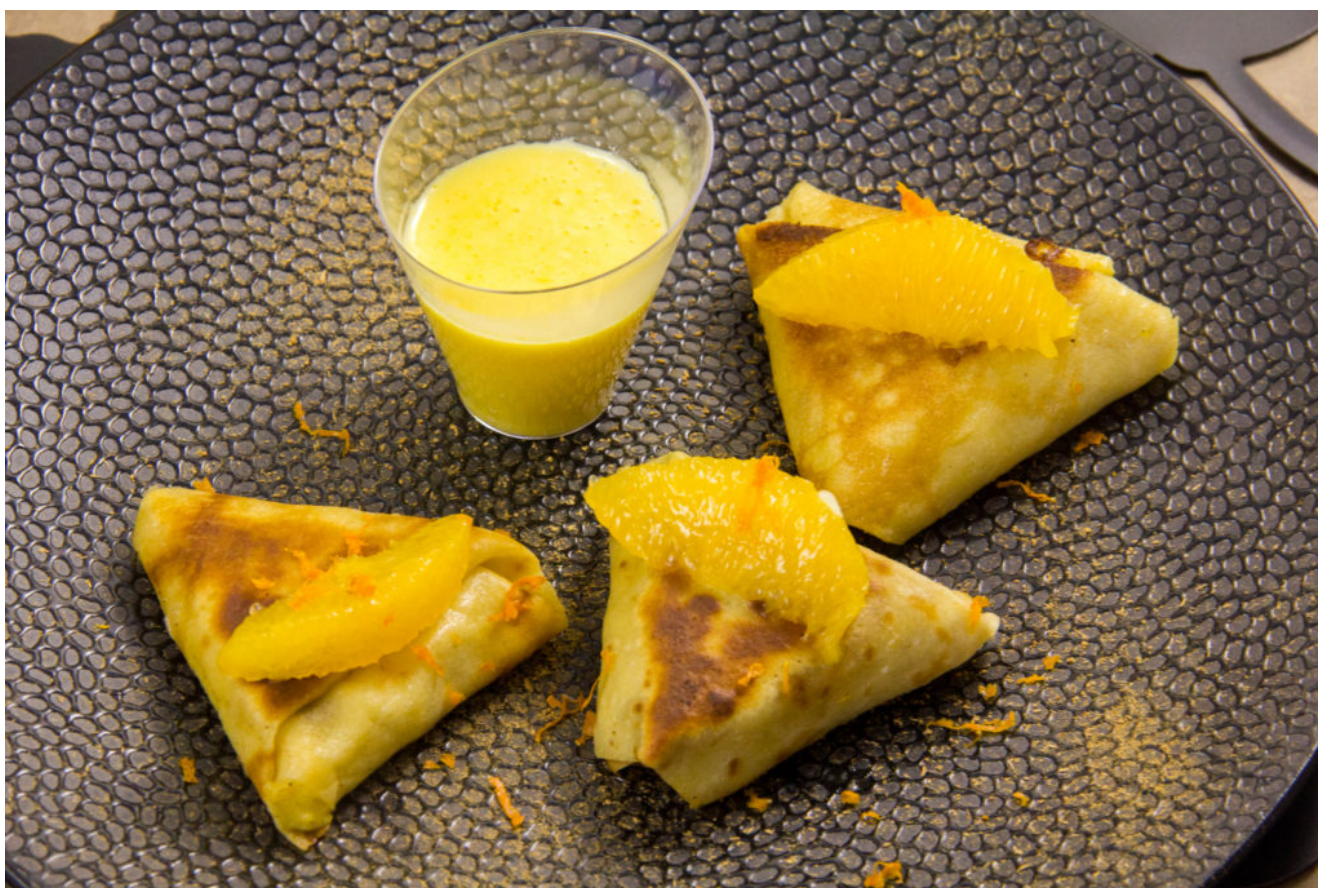
Crêpes Suzette revisitées