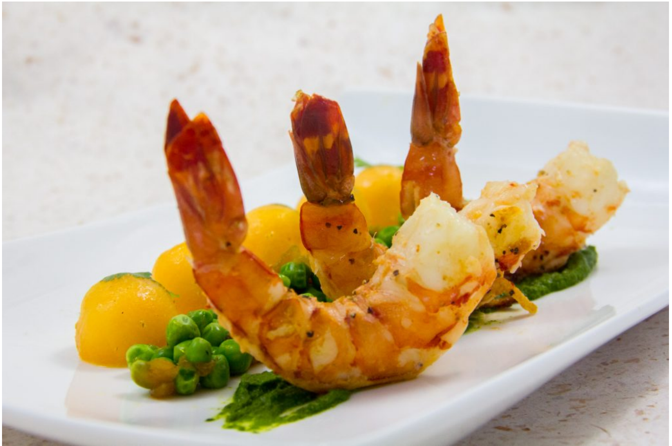
Crevettes tigre basse température, melon et petits pois

Vous y retrouverez mes recettes phares en pas à pas imagées comme dans le blog.