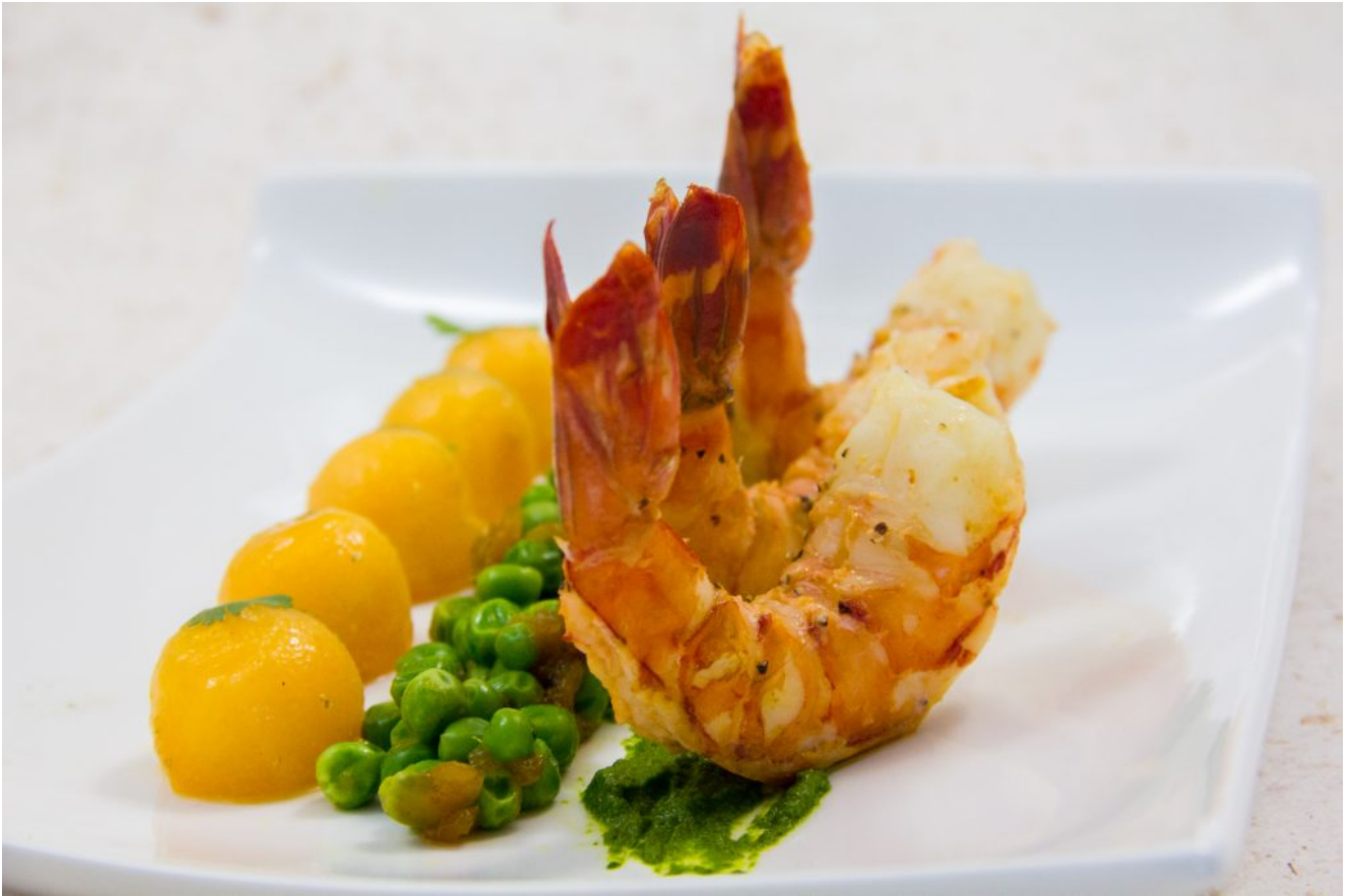
Crevettes tigre basse température, melon et petits pois