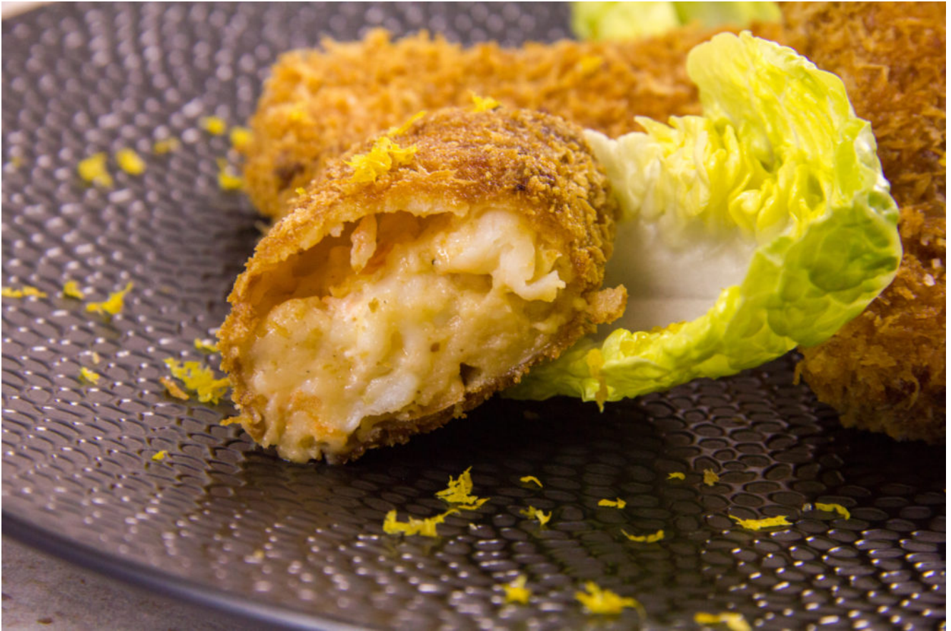
Croquettes de crevette à ma façon