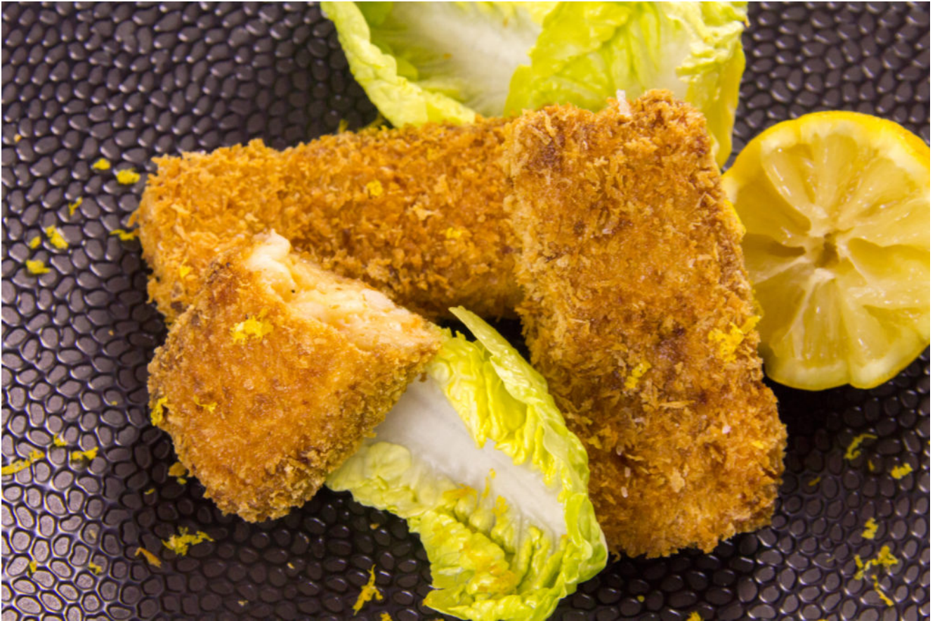
Croquettes de crevette à ma façon