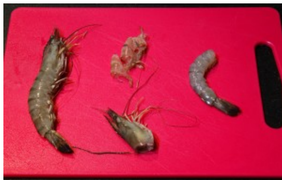
Décortiquez les gambas