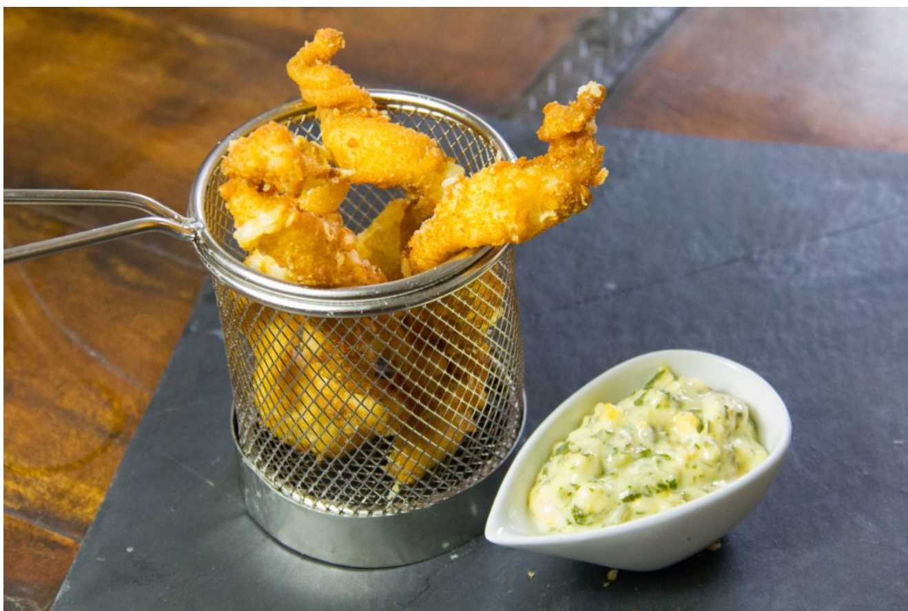
Goujonnettes de sole, sauce gribiche

Régalez-vous aujourd'hui avec ces classiques mais néanmoins délicieuses croquettes de soles (également appelées goujonnettes) servies avec une sauce gribiche. Vous pouvez servir ces croquettes en plat complet en y ajoutant par exemple une salade de riz, une salade ou quelques petits légumes mais c'est également une très bonne idée pour l'apéritif. Les enfants comme les grands vont les adorer!