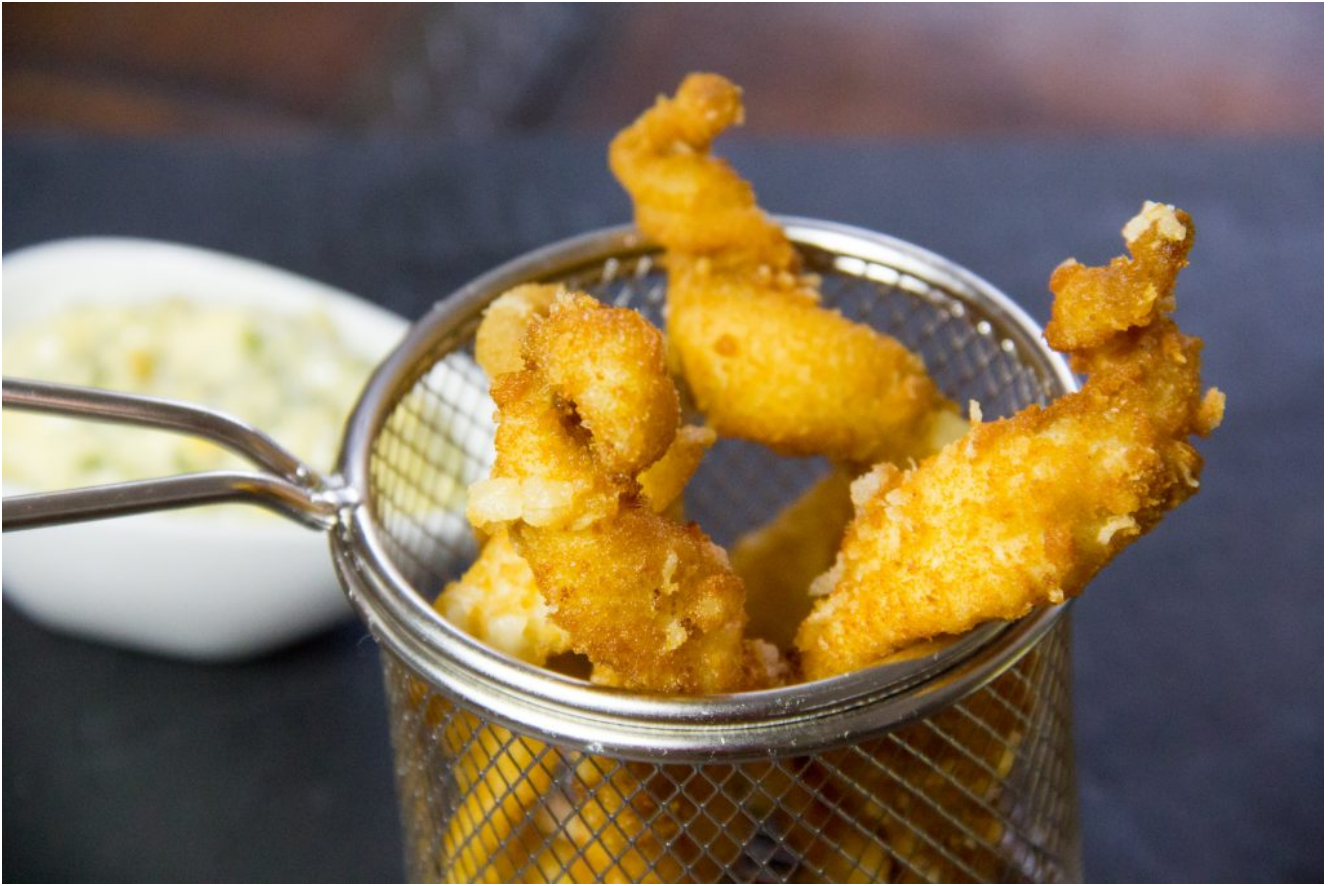
Croquettes de sole sauce gribiche