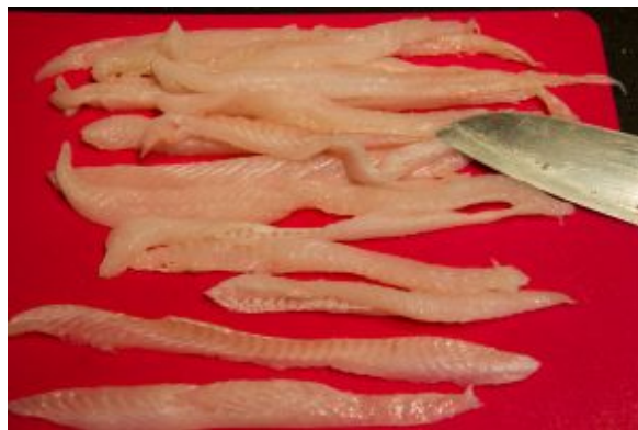
Coupez les filets de soles en deux dans le sens de la longueur