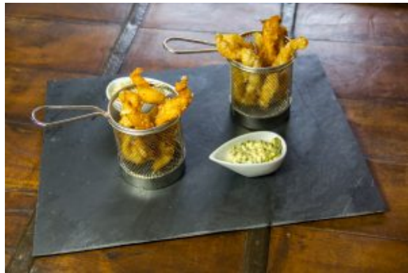
Croquettes de sole sauce gribiche