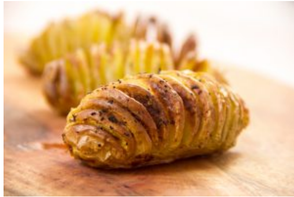
Pommes de terre en éventail