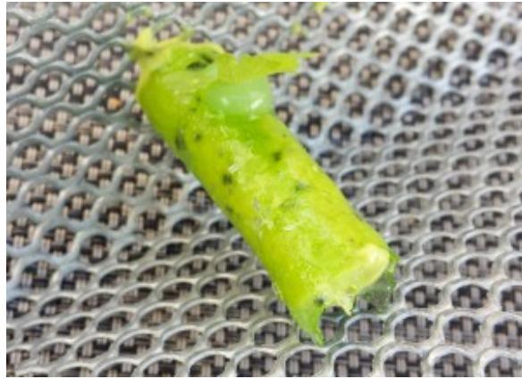
Mousse avocat kiwi et son opaline en sucre

Et le dessert avant-gardiste étonnant, audacieux et savoureux: Fontainebleau et ses meringues à l'aneth, coulis de concombre et sorbet à l'oseille