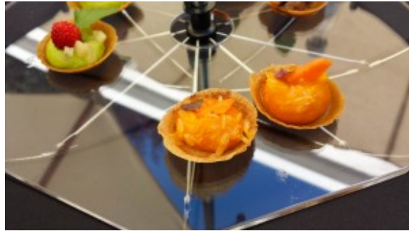
Mise en bouche

Puis une meringue au sésame, mousse de poivron et chorizo.