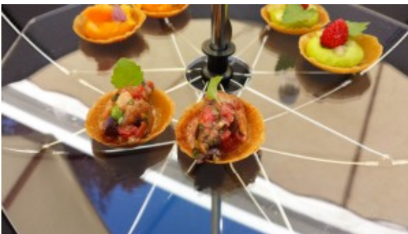
Mise en bouche

Commençons par les amuse-bouches: différentes petites tartelettes (carottes oranges, petite ratatouille aux anchois, petits pois menthe)