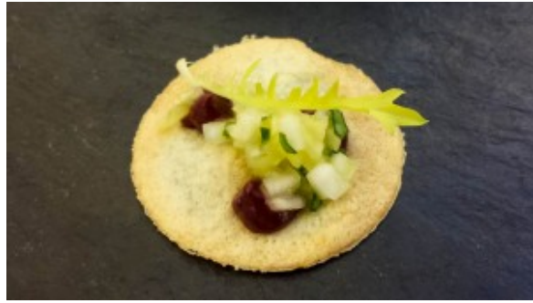
Mise en bouche

Et on attaque les choses sérieuses à savoir les plats du menu!