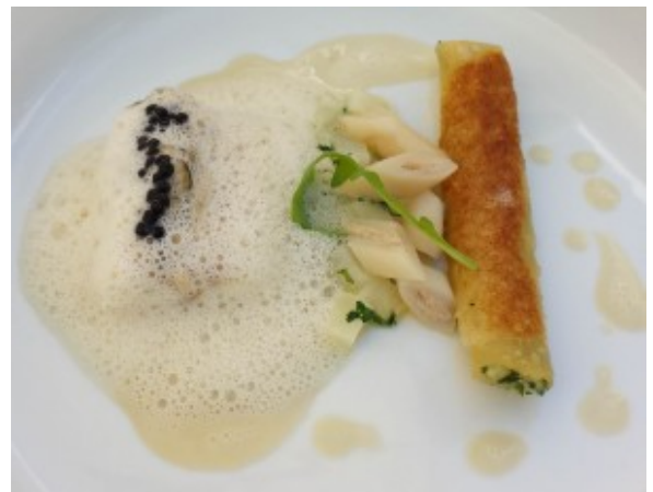
Bar en croûte d'huître à l'assiette