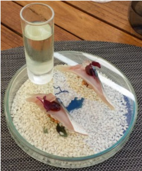
Suchis au riz soufflé

Suchis croustillants de maquereau sur riz soufflé accompagné de ce délicieux vin japonais (yuzu komachi)