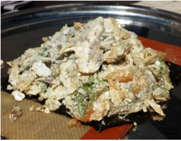
Présentation du bar en croûte d'huître