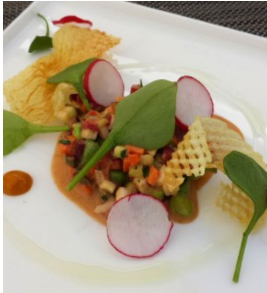
Tartare de légumes

Le plat signature du chef: Bonbons d'huître gelée de livèche. Une tuerie, moi qui n'aime pas les huîtres... C'est là que l'on voit le talent d'un grand chef!