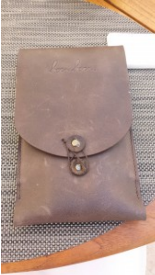
La pochette de couverts