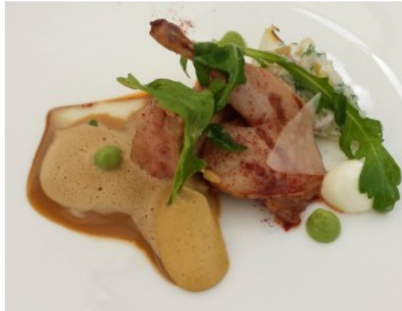
Caille basse température

Caille basse température , épices tandori et sauce langoustine.