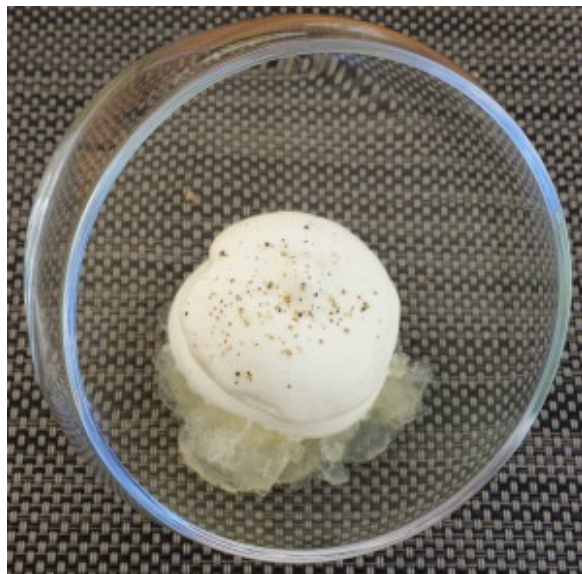
Crème de gorgonzola sur granité de champagne

Crème de gorgonzola , granité de champagne