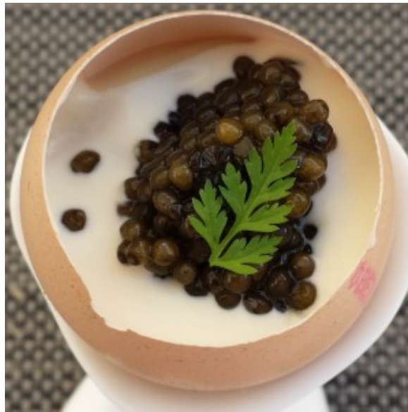
Oeuf parfait, chou fleur, tarama et caviar

Oeuf parfait crème de chou fleur, tarama et caviar