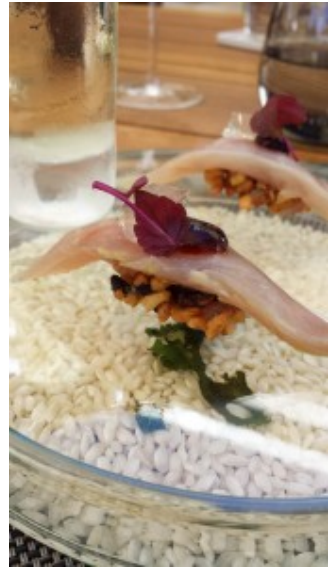
Suchis au riz soufflé