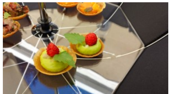
Mise en bouche