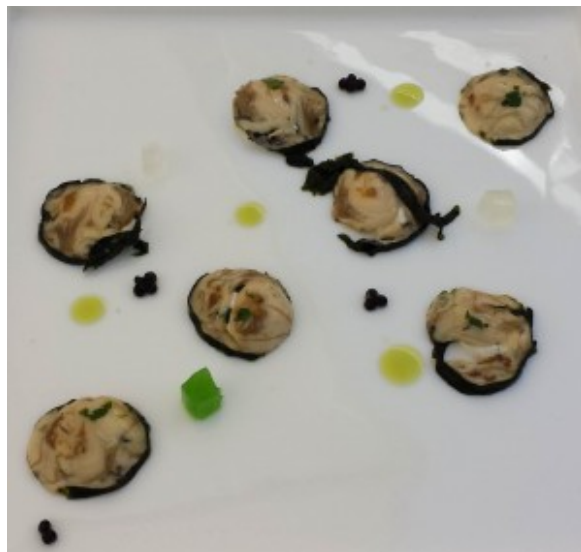
Le plat signature du chef

Le plat signature du chef: Bonbons d'huître gelée de livèche. Une tuerie, moi qui n'aime pas les huîtres... C'est là que l'on voit le talent d'un grand chef!