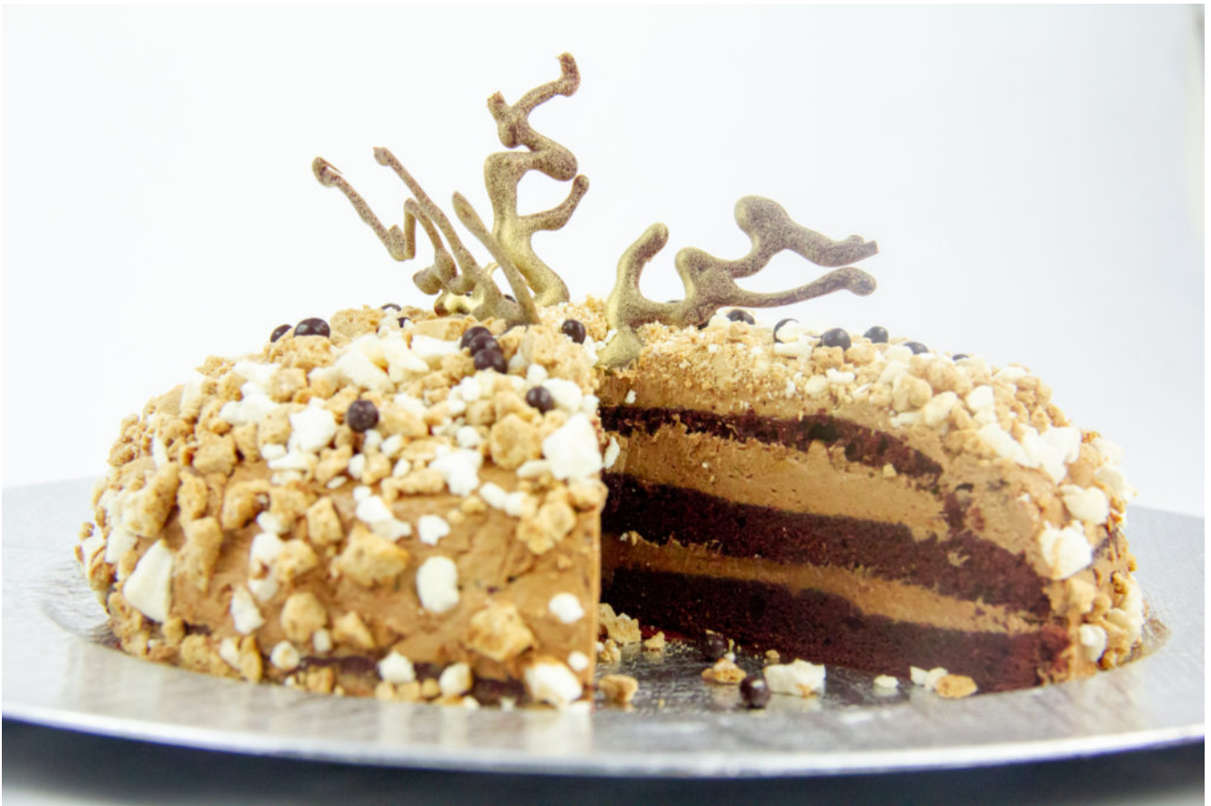
Délicieux café chocolat

Ce Délicieux café chocolat est un gâteau un peu technique mais tellement bon!