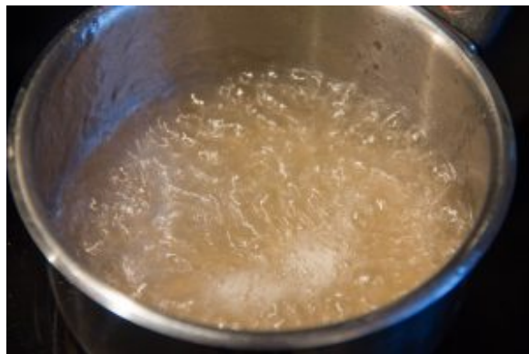
Préparez un sirop