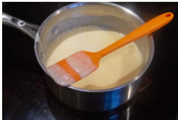
La crème anglaise est prête