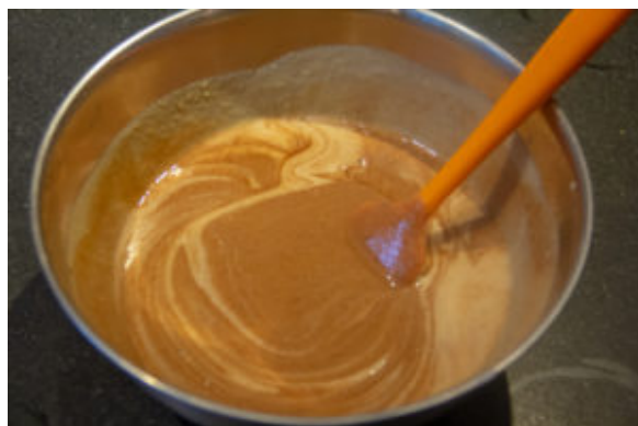
Versez la crème sur le chocolat