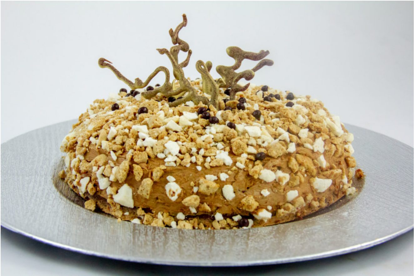
Délicieux café chocolat