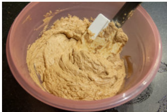
Réalisez la crème au beurre

pas trop vite. Versez doucement votre crème anglaise au chocolat par dessus. Il faut fouetter assez longtemps pour que la crème prenne. Si jamais elle devenait granuleuse il faut chauffer légèrement la cuve de votre batteur au chalumeau (il faut bien sûr qu'elle soit en acier...et non en plastic) ou alors il faut ajouter un petit peu d'eau tiède et continuer à fouetter plus vivement. Réservez au frais le temps que votre gâteau ait complètement refroidi.