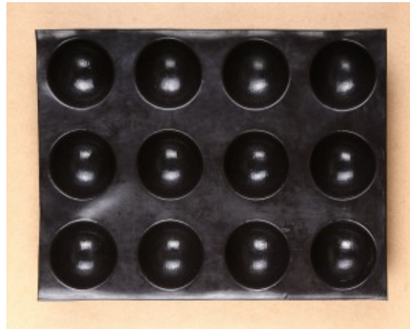
moûle antiadhésif pour la cage isomalt