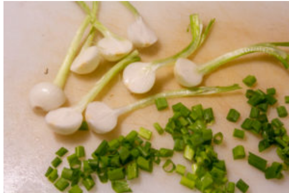
Coupez les oignons jeunes