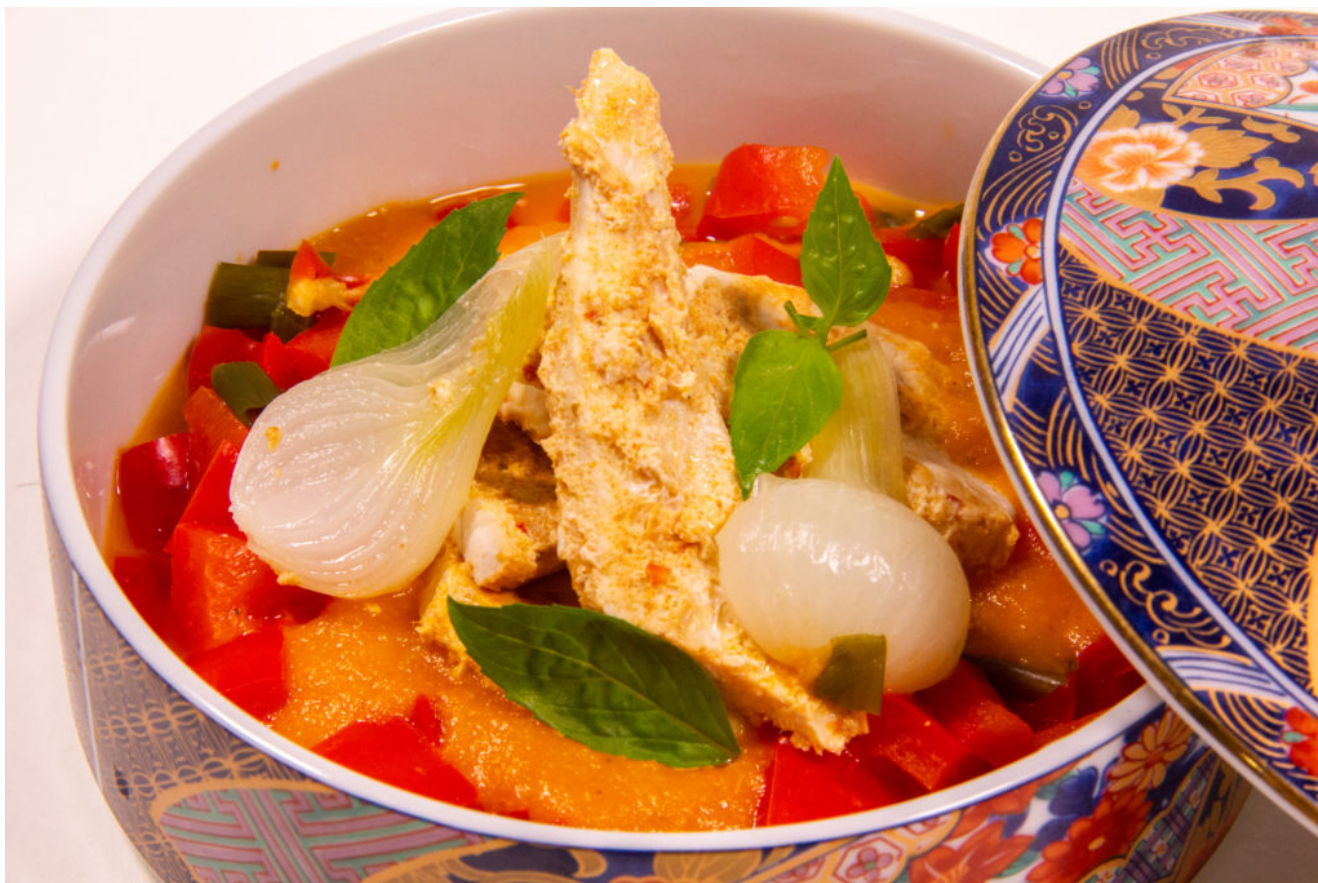
Émincés de volaille au curry rouge (recette Thermomix)