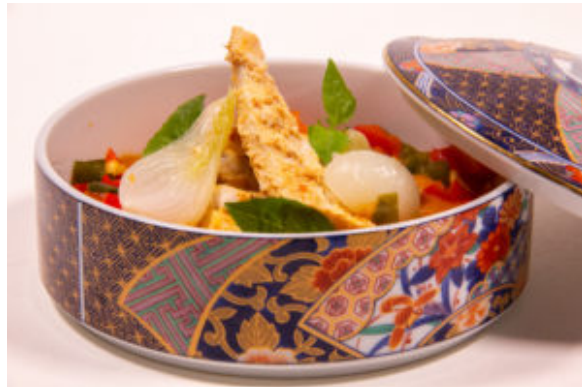
Émincés de volaille au curry rouge (recette Thermomix)