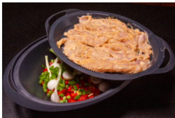
Disposez les éléments dans le Varoma