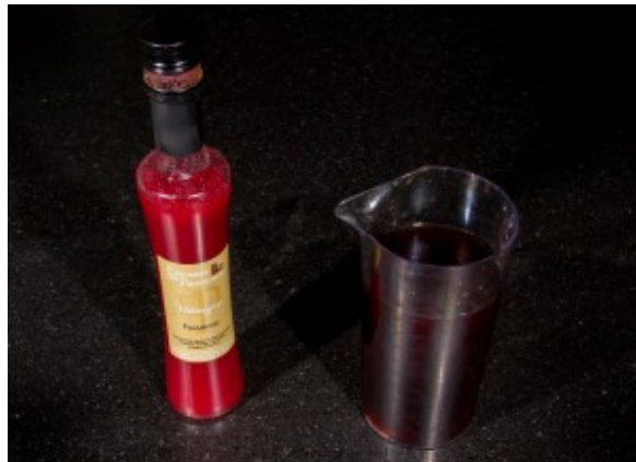
Ingrédients pour la réduction