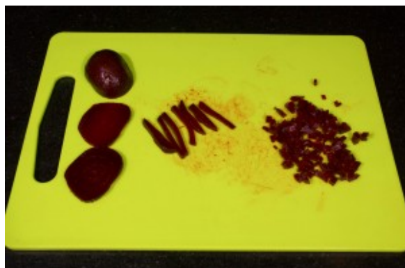
Coupez les betteraves de la même façon