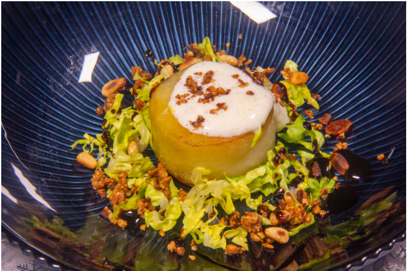
Espuma au Maroilles et ses petites pommes de terre