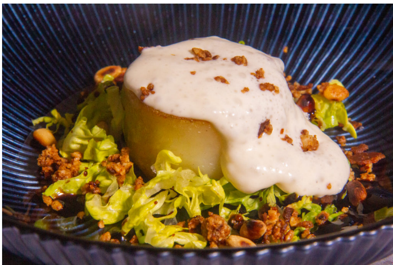
Espuma au Maroilles et ses petites pommes de terre

Il vous faudra utiliser un siphon pour l'espuma. Pour plus de renseignements sur la bonne utilisation d'un siphon cliquez ici .