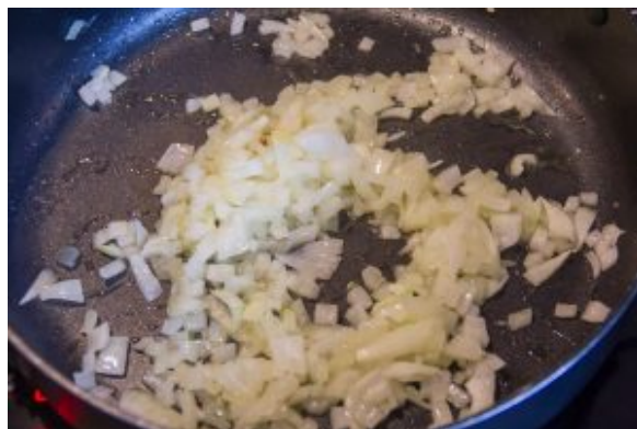
Faites revenir l'oignon dans une poêle avec un peu de beurre