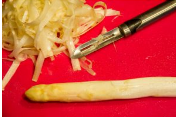
Pelez les asperges blanches

l'économe à trois centimètres de la pointe puis d'un geste sec ôtez la peau sur toute la longueur. Petite astuce: ne jetez pas les pelures d'asperges. Vous pouvez les utiliser pour en faire une délicieuse soupe...Si vous utilisez les asperges vertes il n'est pas nécessaire de les peler. Coupez juste l'extrémité filandreuse. Réservez.