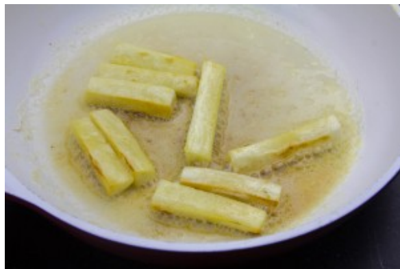
Cuire les frites de panais