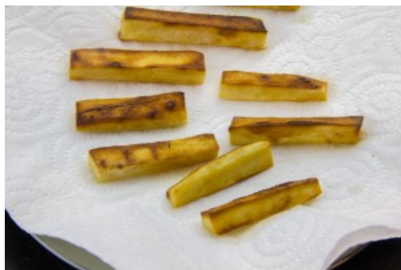
Les frites de panais sont cuites