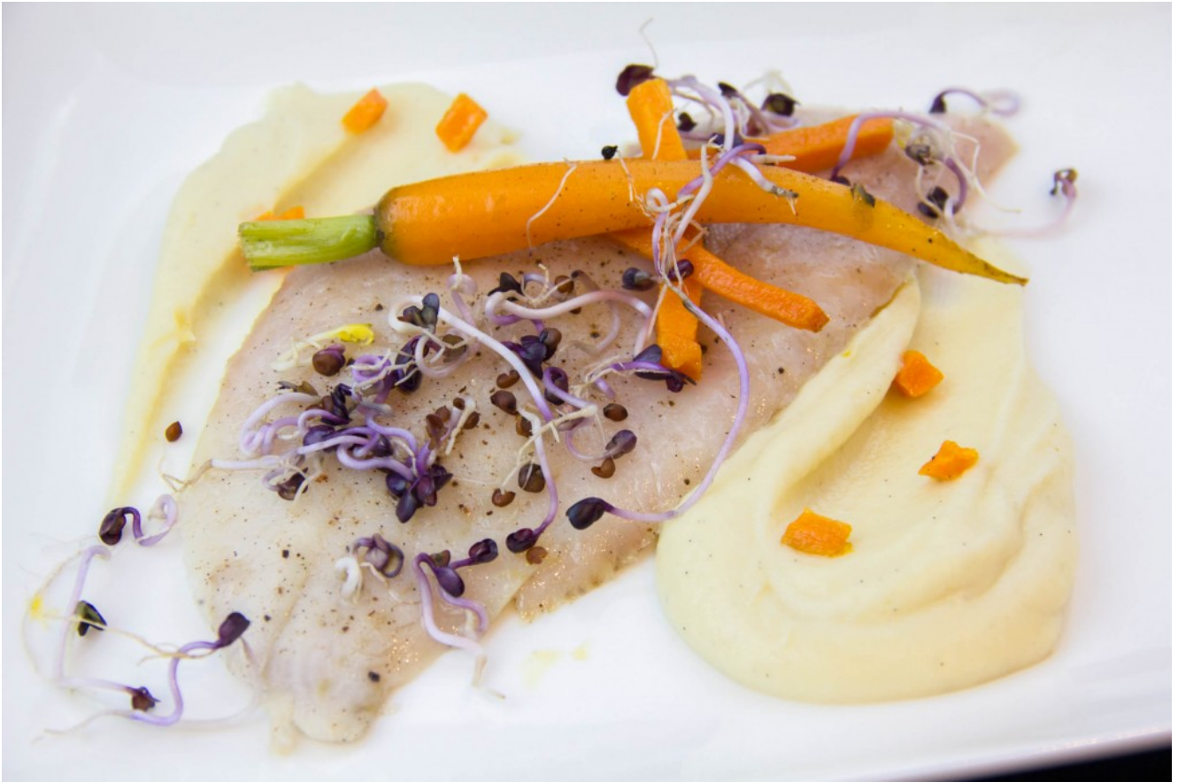
Filet de dorade basse température, purée de panais et vanille