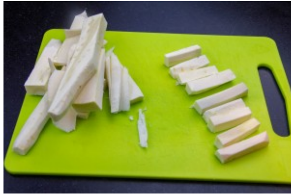
Coupez un panais en tranches