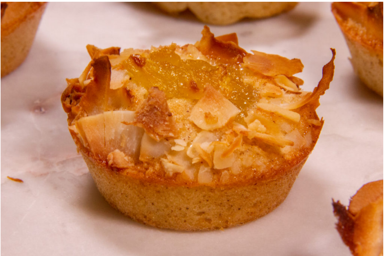
Financiers ananas confit et coco

Le financier est une pâtisserie ultra facile à réaliser en peu de temps et ne demande aucun savoir ou technique particulière. Il est moelleux et savoureux ... Vous avez envie de vous régaler? Alors vite à vos fourneaux!