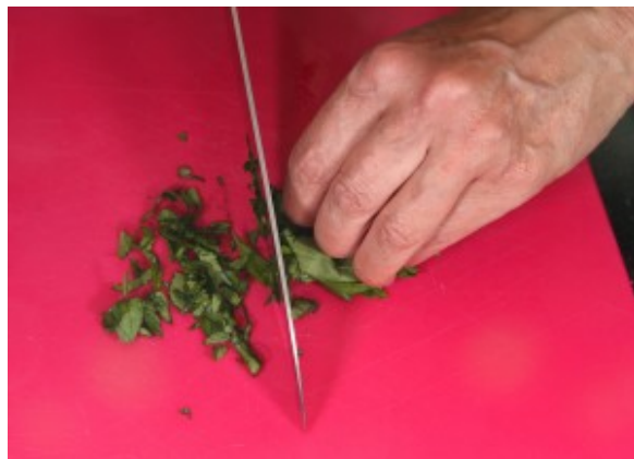
Ciselez le basilic