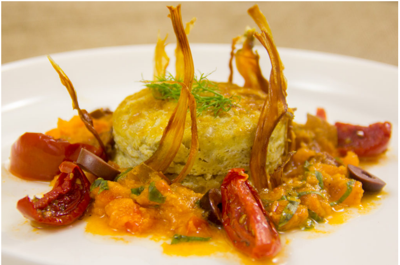
Flan de fenouil, sauce tomatée