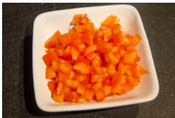
Coupez les tomates en quatre et ôtez les pépins. Coupez-les en brunoise