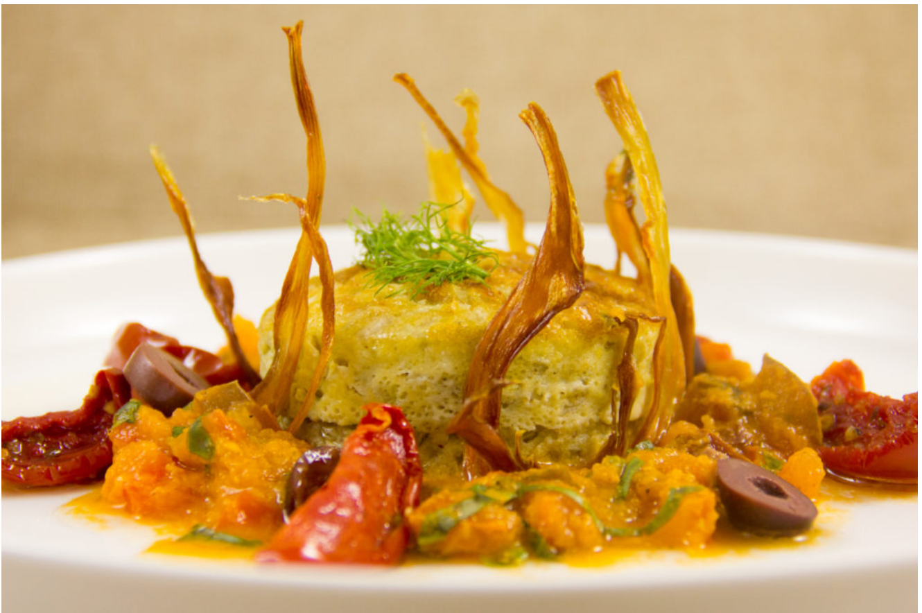
Flan de fenouil, sauce tomatée

La cuisine végétarienne voire végan est de plus en plus d'actualité. Malheureusement les légumes sont souvent assimilés à des mauvais souvenirs d'enfance ou de cantine assez fades voire pas très bons et j'entends souvent les gens dire « Oh il y a quand même plus gourmand qu'un plat de légumes! ». Mais ce n'est pas vrai! Les légumes ne se cuisinent pas seulement à l'eau et vous pouvez réaliser d'excellents plats gastronomique à base de légumes. Je vous propose aujourd'hui un Flan de fenouil accompagné de chips de fenouil et d'une sauce tomate maison parfumée au basilic et olives de Kalamata. Et ne vous y trompez pas , c'est une véritable gourmandise!